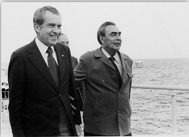
Р.НИКСОН И Л.И.БРЕЖНЕВ