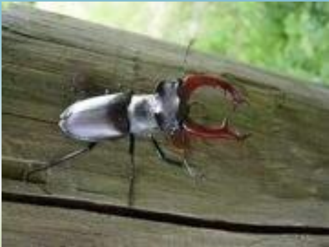
ЖУК - ОЛЕНЬ

Самый крупный жук Европы. Тело черного цвета, матовое. У самца надкрылья и верхние челюсти коричневые, у самки надкрылья черно-бурые. Длина тела 25-75 мм, при этом жуки из разных мест заметно отличаются друг от друга размерами.