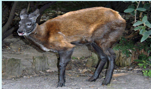
Кабарга-животное, породившее множество мифов и суеверий