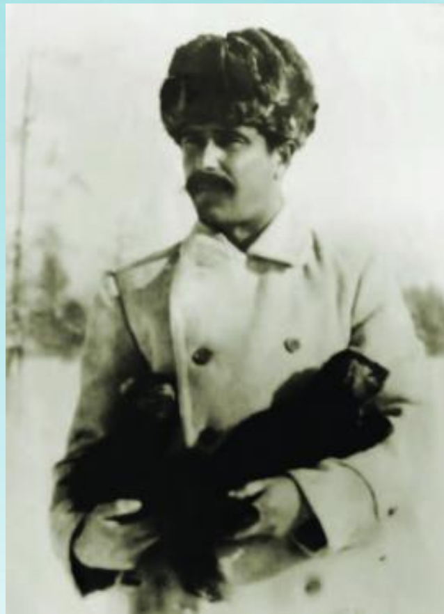
Зенон Францевич Сватош