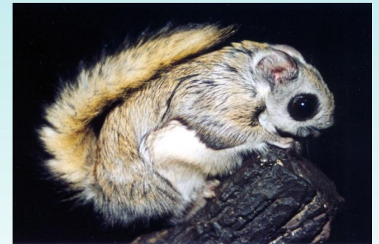
Белка - летяга