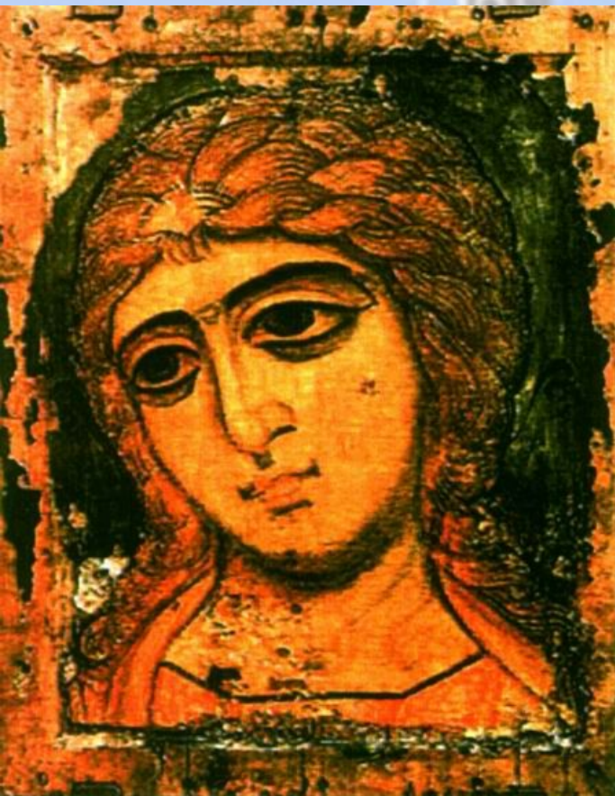
Ангел Златые власы