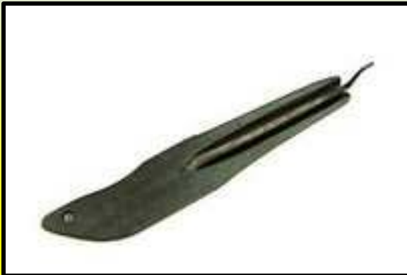
японский бамбуковый бамыр