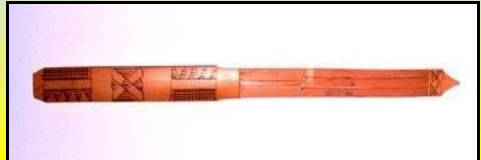
филлипинский деревянный кубыз