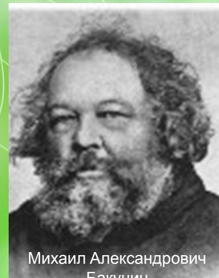
Михаил Александрович Бакунин