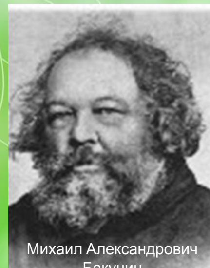
Михаил Александрович Бакунин