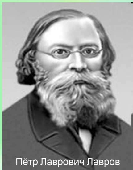
Пётр Лаврович Лавров