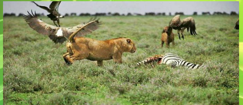
Борьба с неблагоприятными условиями среды