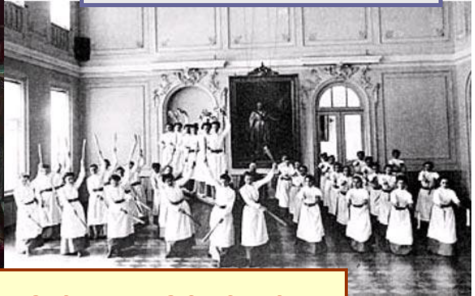
Институт благородных девиц

Чем твоя школа отличается от старой русской школы? Чему учит школа? (стр. 107)