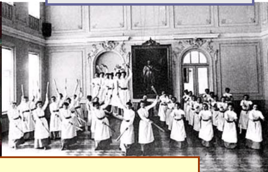
Институт благородных девиц

Чем твоя школа отличается от старой русской школы? Чему учит школа? (стр. 107)