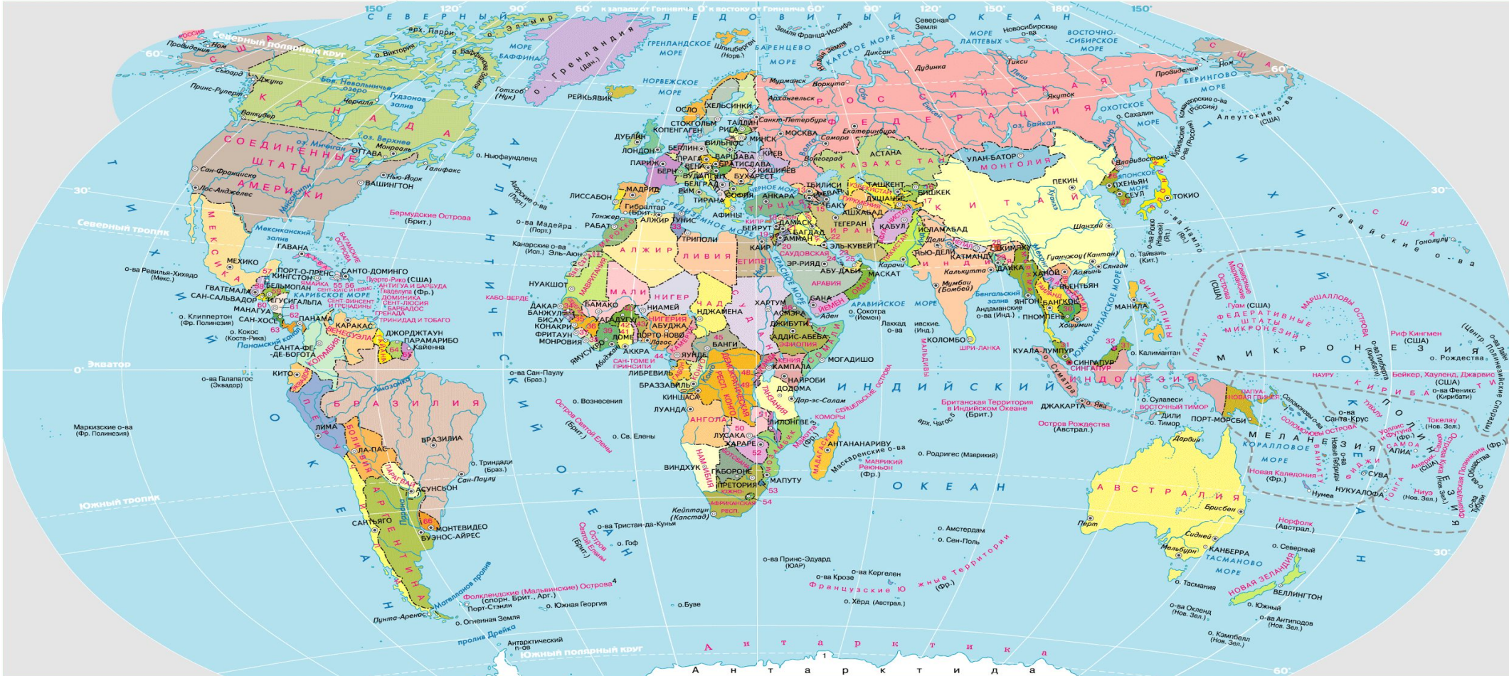
ЦИФРАМИ НА КАРТЕ ОБОЗНАЧЕНЫ