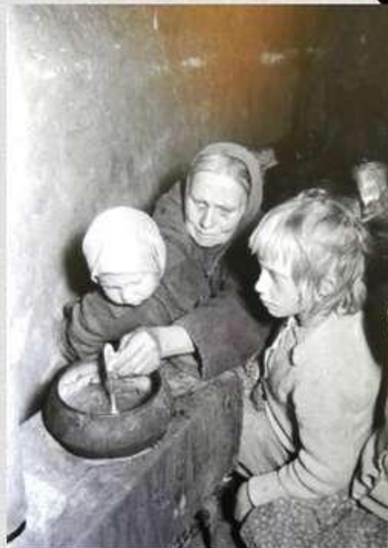
Похлебка из мха 1943 год