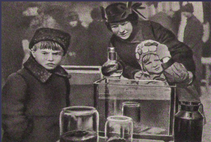
Кадр из кинокартины «Каштанка»