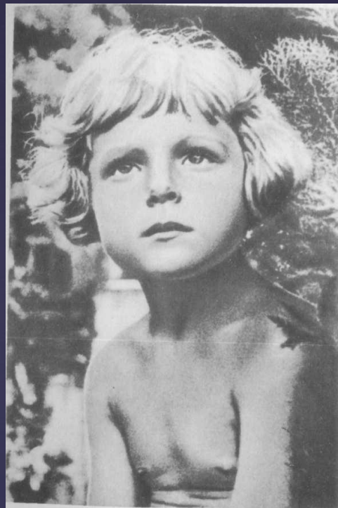
Гуле 3 года