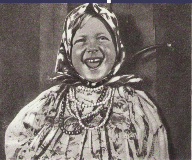
Ну чем не баба рязанская? Кадр из кинофильма «Бабы рязанские»