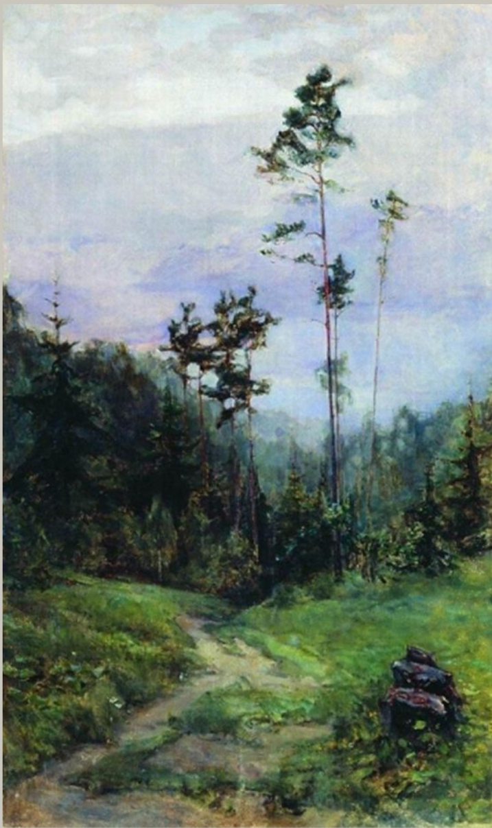
Уральский пейзаж 1930