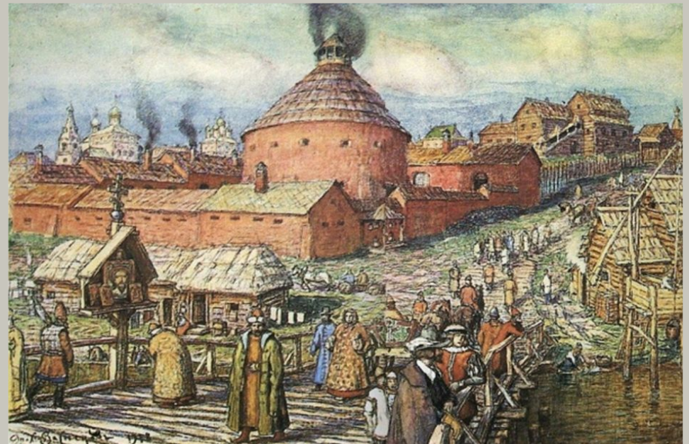
Пушечно-литейный двор на реке Неглинной в XVII век. 1918