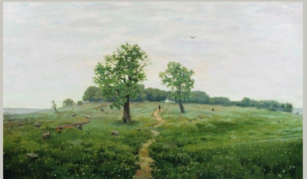
Серый день (Серенький денек). 1883