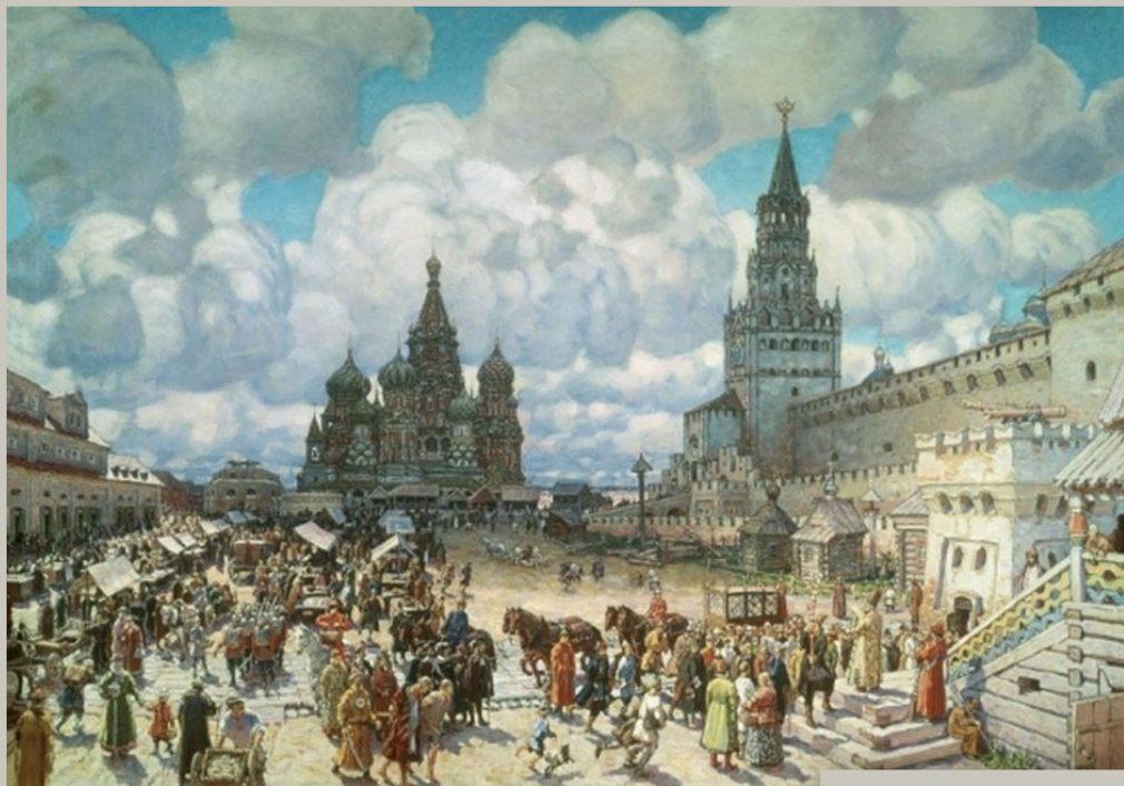
Красная площадь во второй половине XVII века. 1925