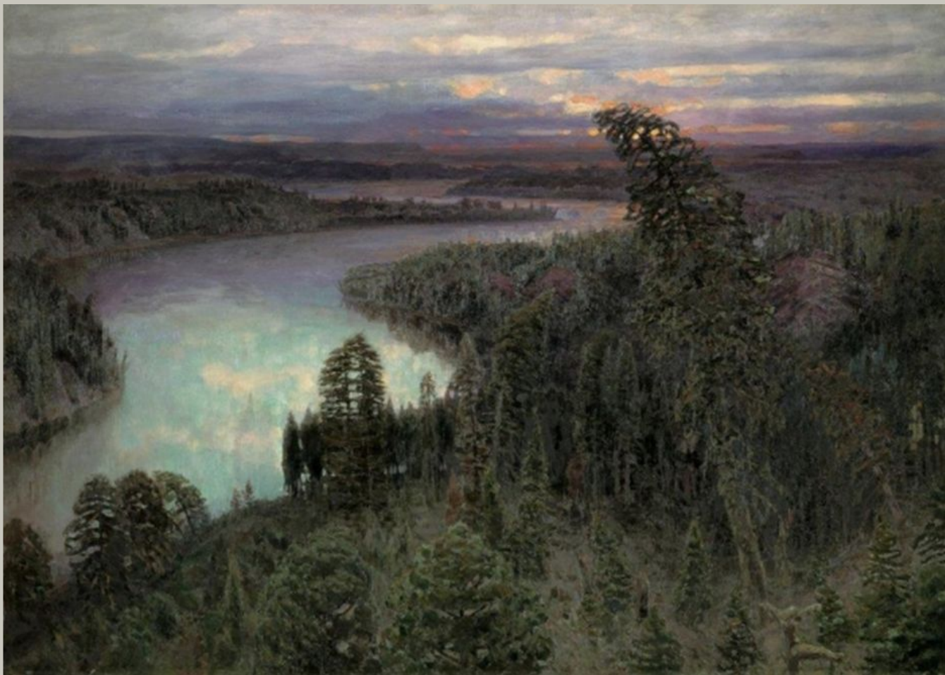
Северный край. 1899