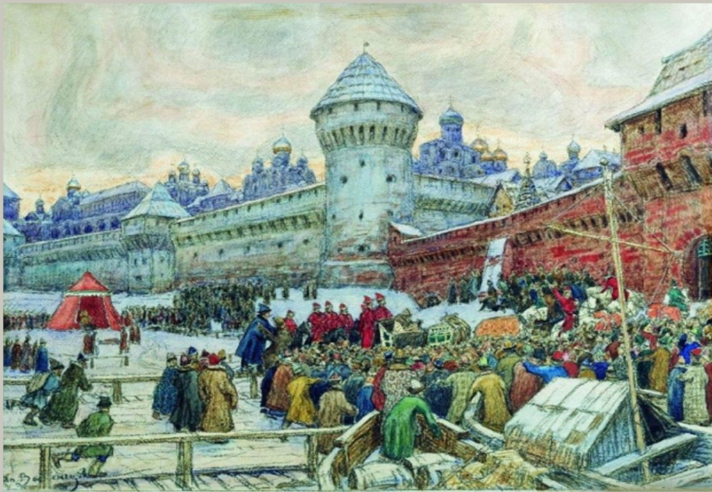
Старая Москва. Отъезд с кулачного боя. 1900-е