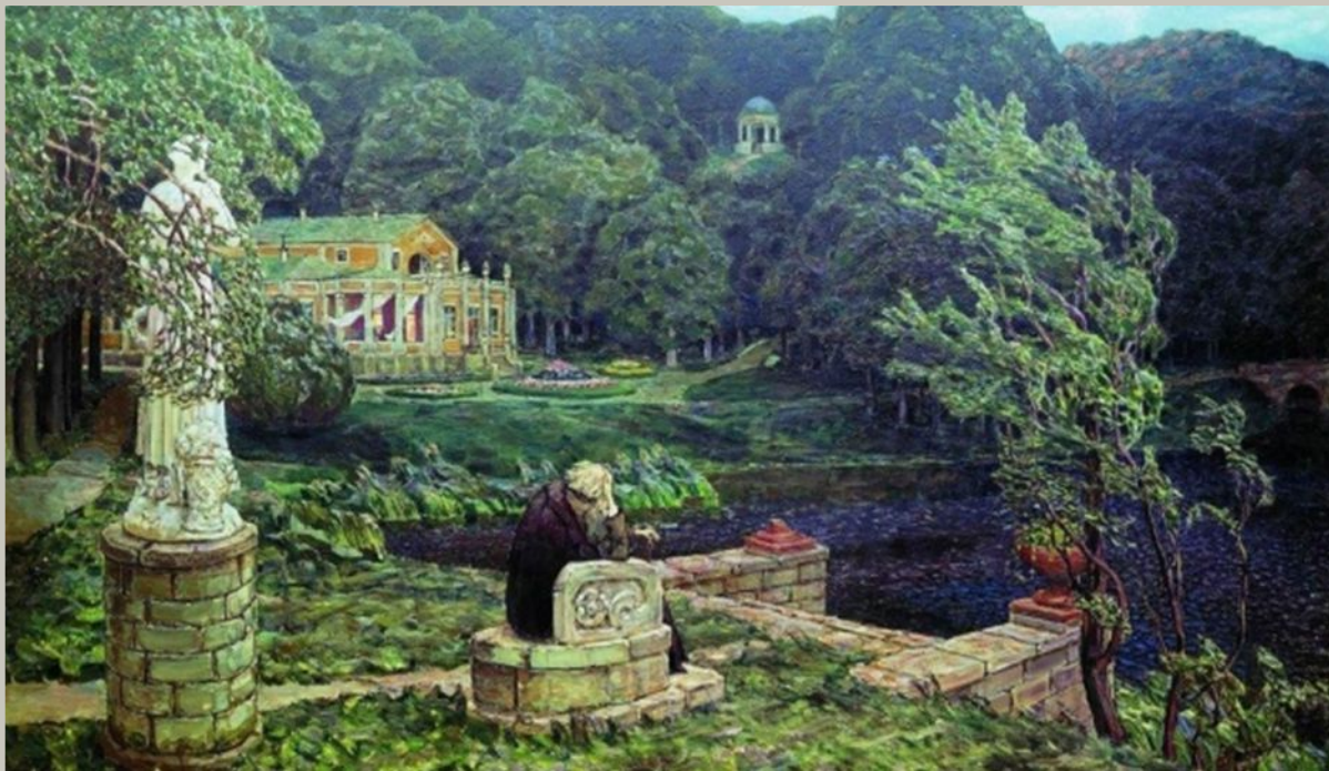
Шум старого парка. 1926