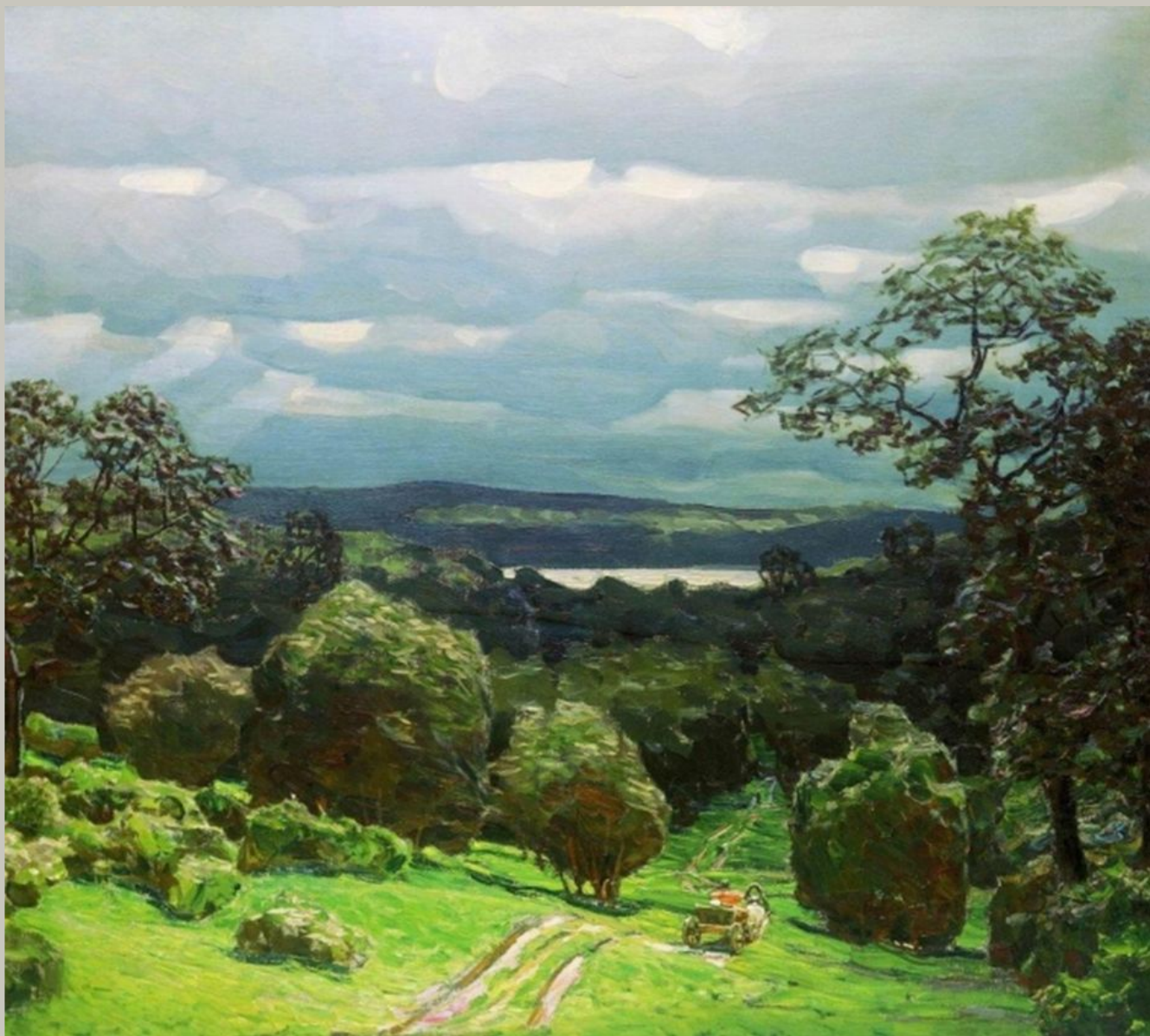
Сумрачный день. 1919