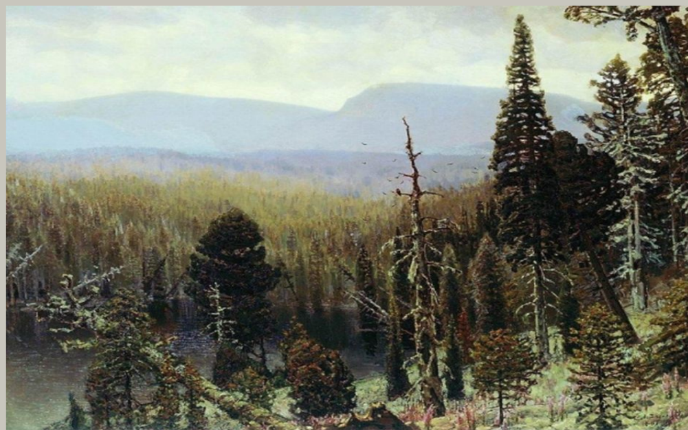
Тайга на Урале. Синяя гора. 1891