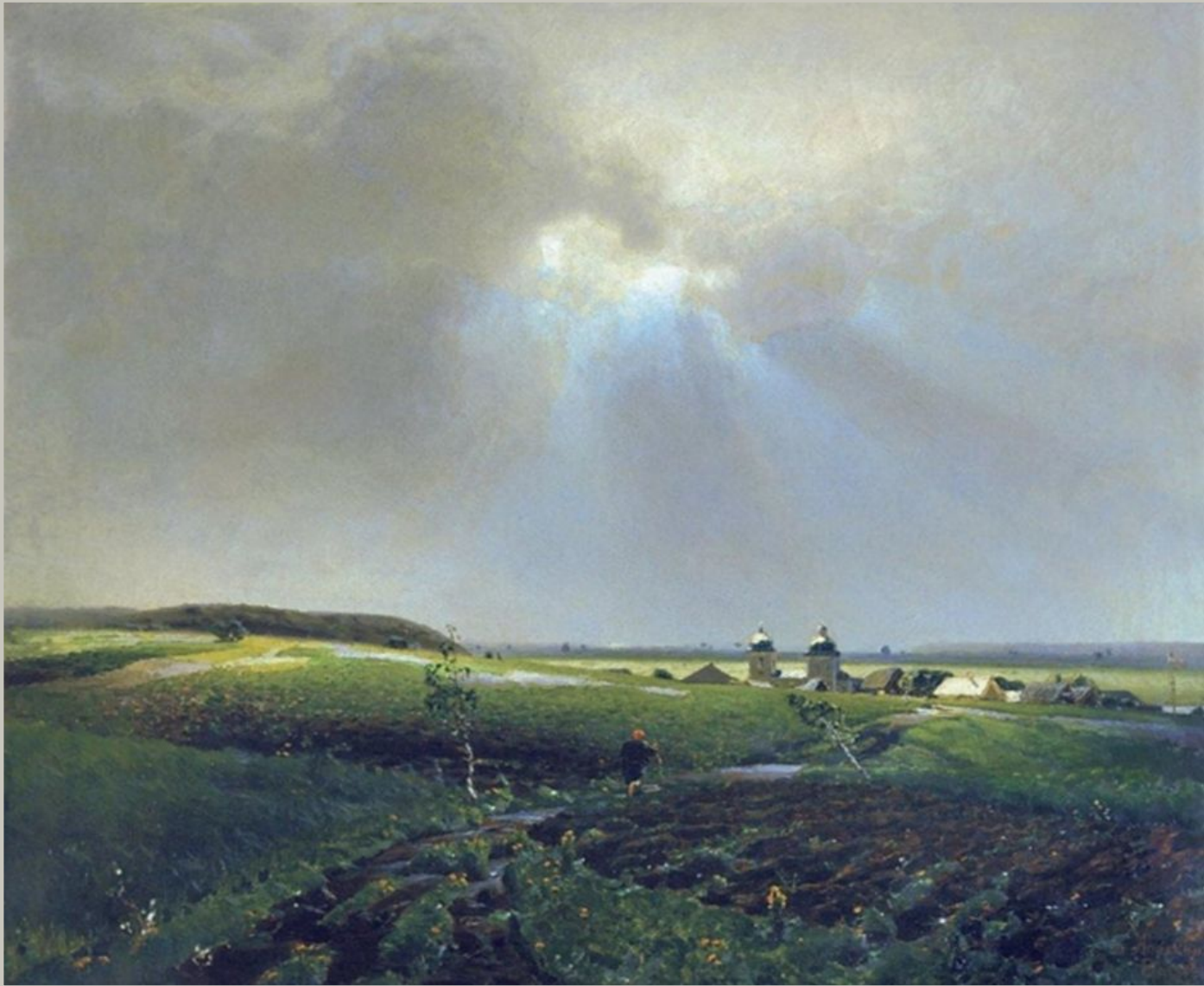
После дождя. 1887