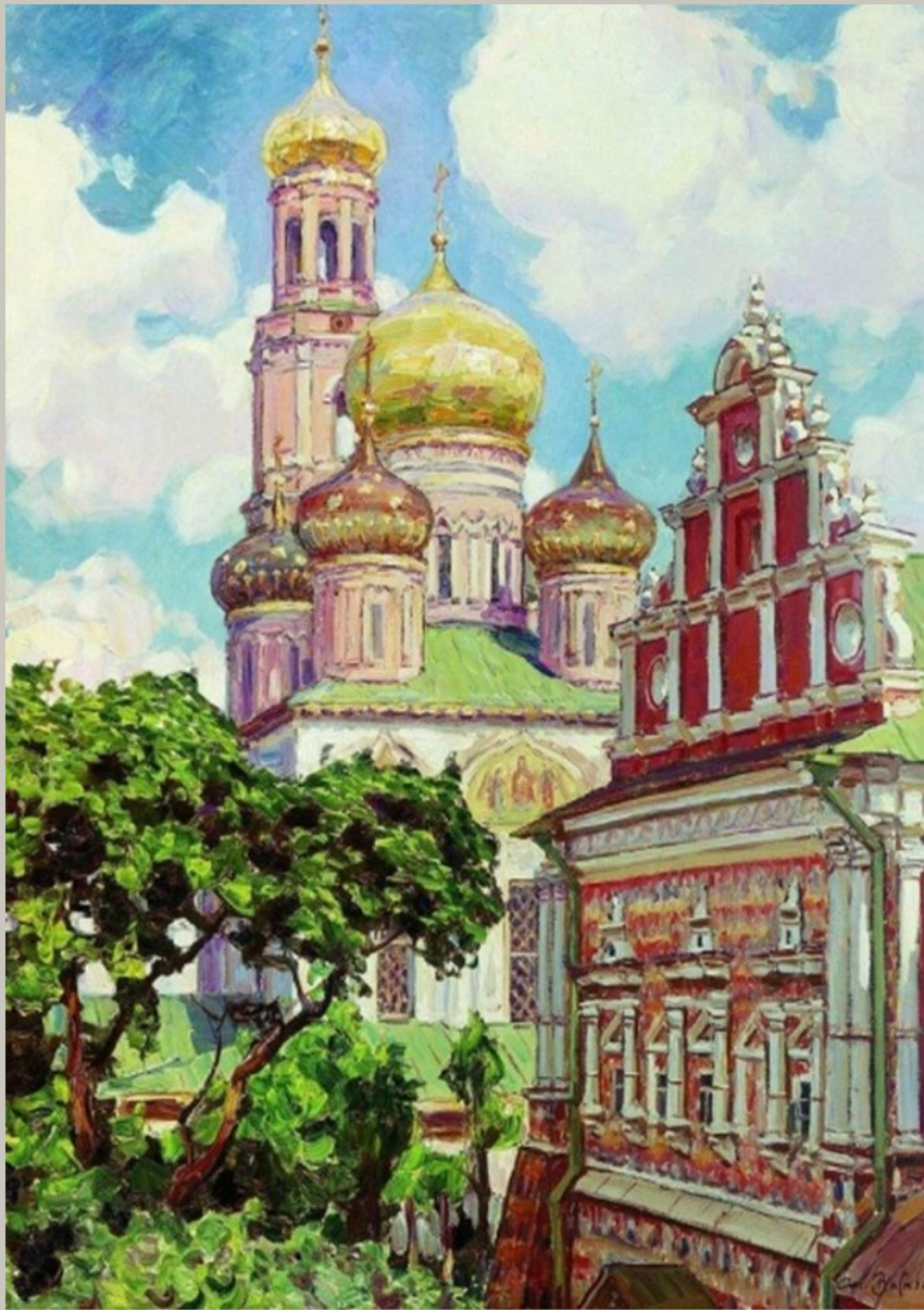
Симонов монастырь. Облака и золотые купола. 1927