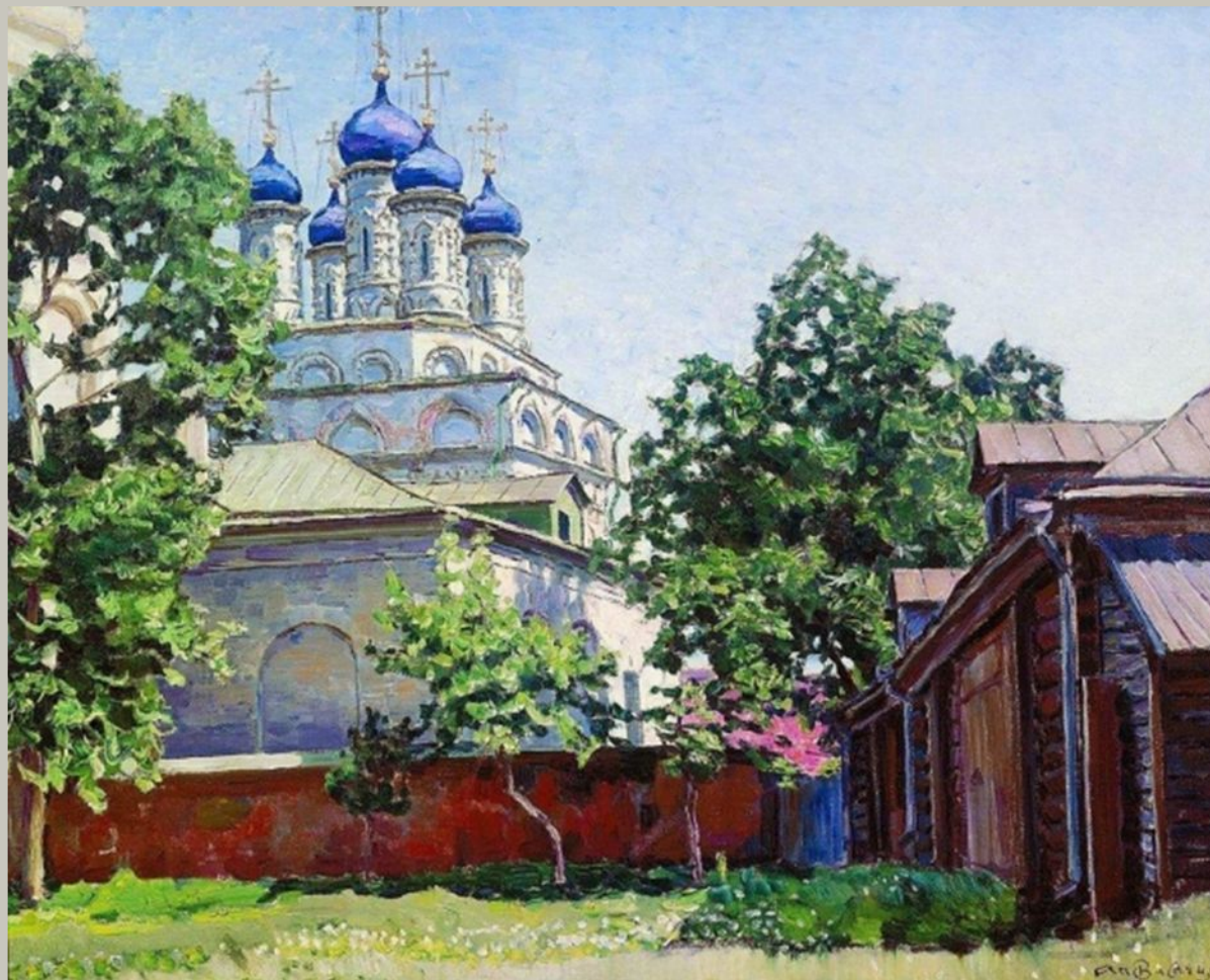
Троицкая церковь на Берсеневке. 1922