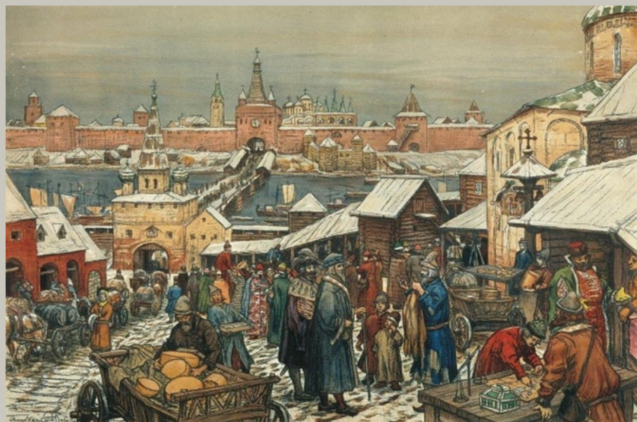
Торг в Нижнем Новгороде. 1908-1913