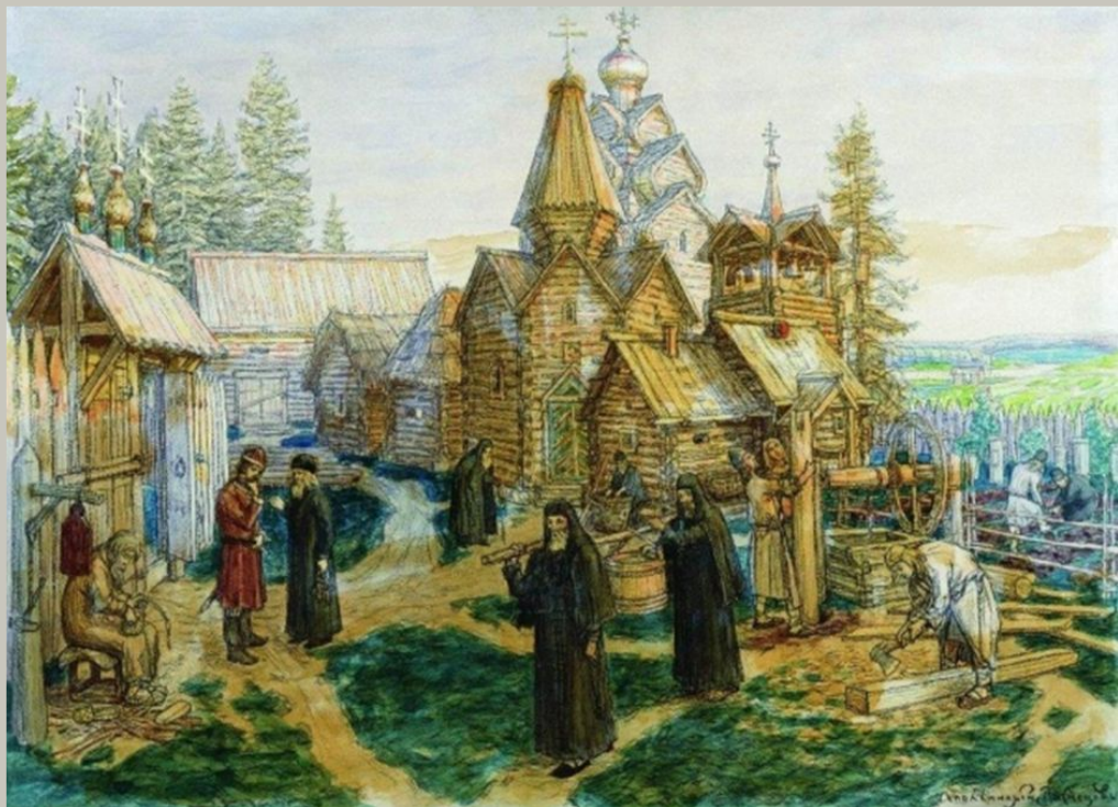
Троице-Сергиева лавра. 1908-1913