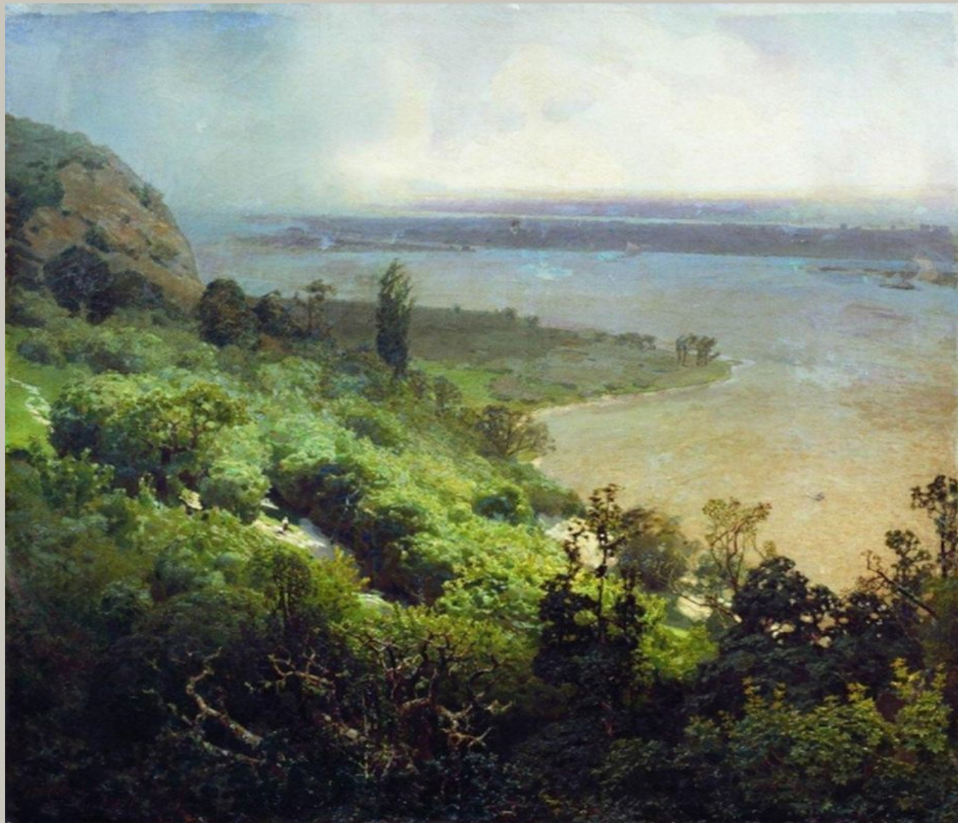
Днепр перед бурей. 1888