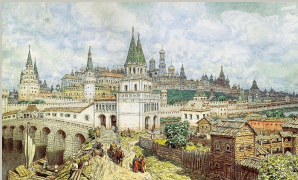
Расцвет Кремля. Всехсвятский мост и Кремль в конце XVII века. 1922