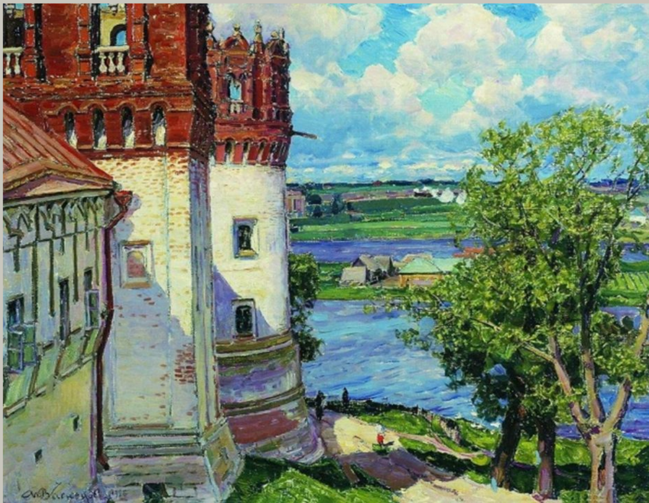
Новодевичий монастырь. Башни. 1926