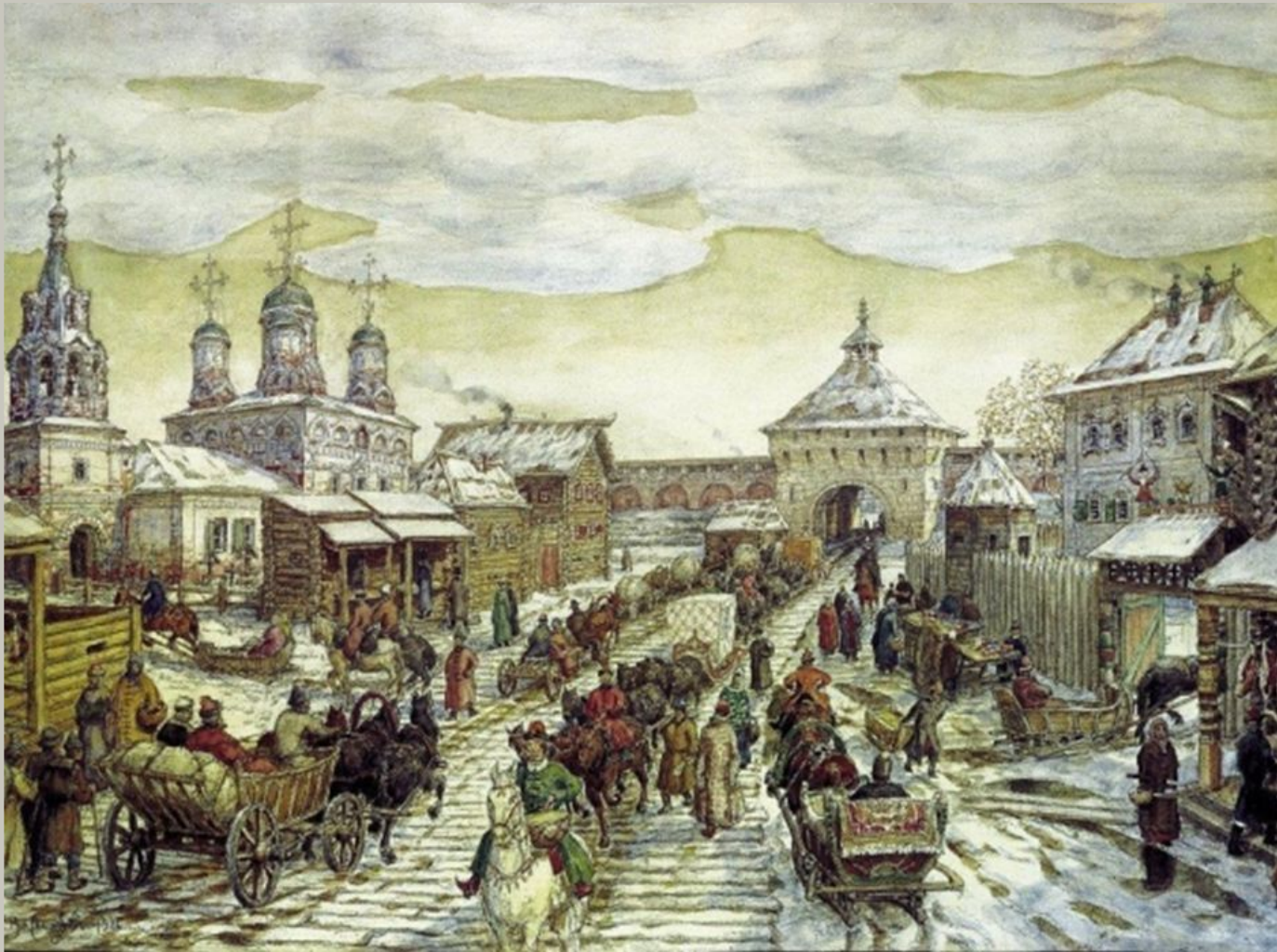
У Мясницких ворот Белого города в XVII веке. 1926