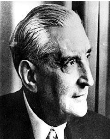
Антониу ди Салазар

Образцы корпоративного режима - правление Антониу ди Салазара в Португалии (1932-1968), режим Франсиско Франко в Испании. В Латинской Америке отсутствие широкой политической мобилизации масс не раз позволяло внедрять корпоративное представительство интересов.