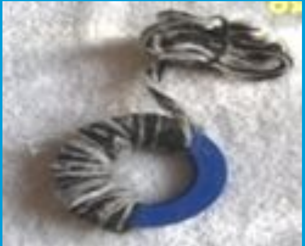
Классический круглый помпон