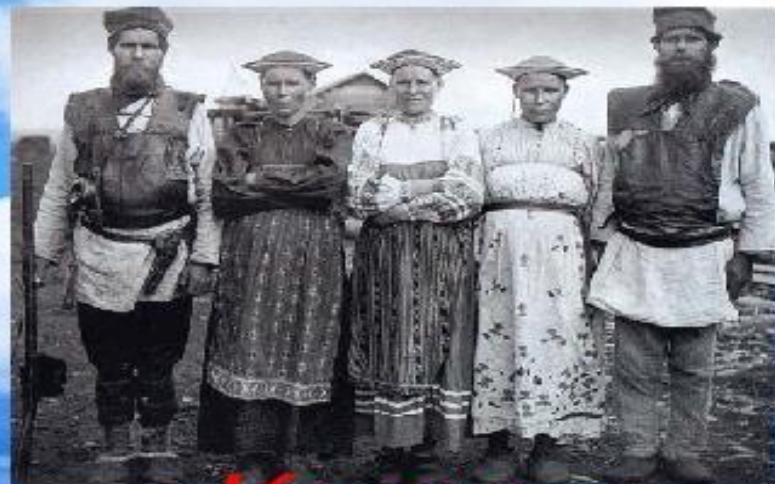
КОМИ - ПЕРМЯКИ