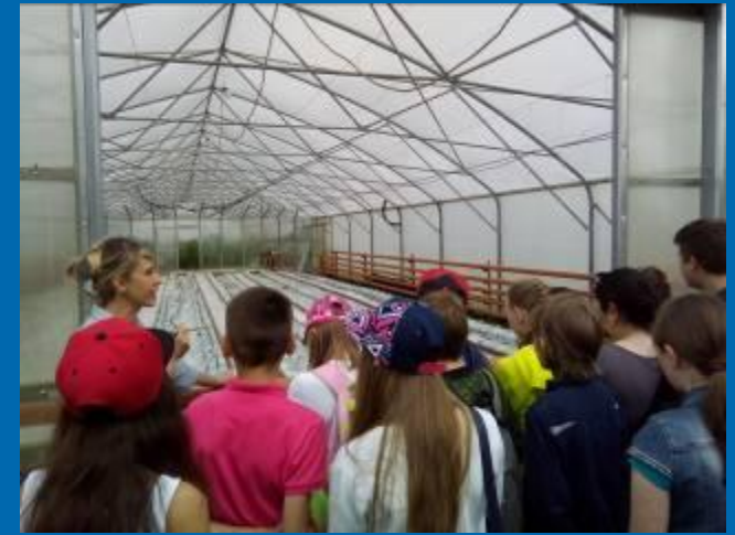
▣ Экскурсия в эколого – биологический центр