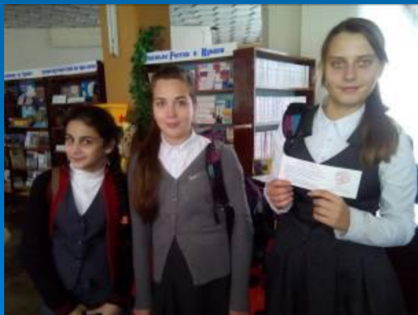
Книжная экологическая выставка