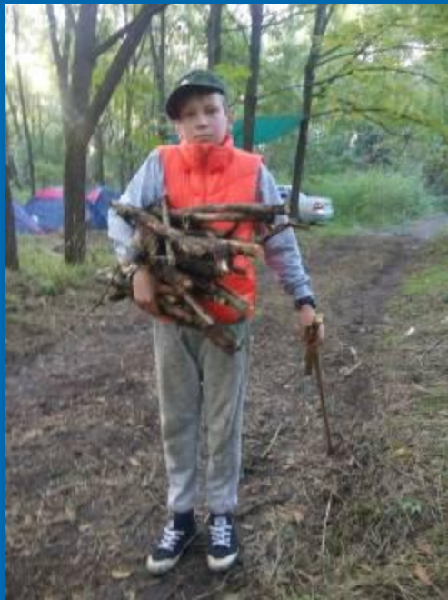
▣ Поход в лес!