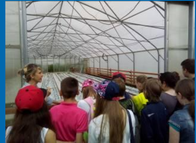
▣ Экскурсия в эколого – биологический центр