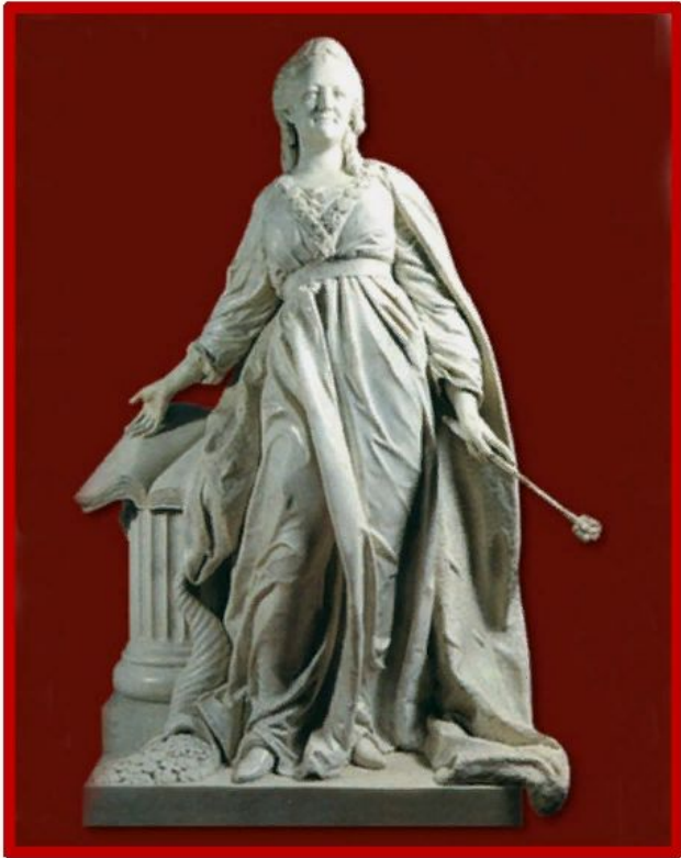
Шубин Ф. И. Статуя «Екатерина- законодательница»

Наконец, нельзя не упомянуть о великолепных достижениях русских скульпторов XVIII столетия. В числе первых стоит знаменитый Ф. И. Шубин (1740–1805 гг.) . Тенденции реализма, острая портретная характеристика выражены в его творчестве четко, рельефно.