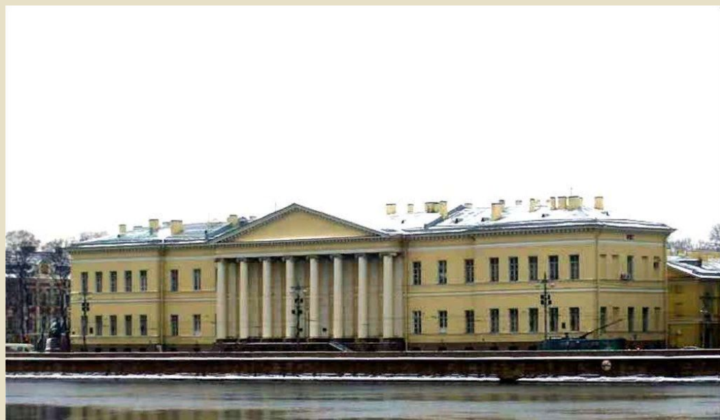
Джакомо Кваренги Академия наук в Петербурге

Одновременно с русскими зодчими в России успешно работали и иностранцы. Среди них наиболее талантливыми были шотландец Чарльз Камерон и итальянец Джакомо Кваренги.