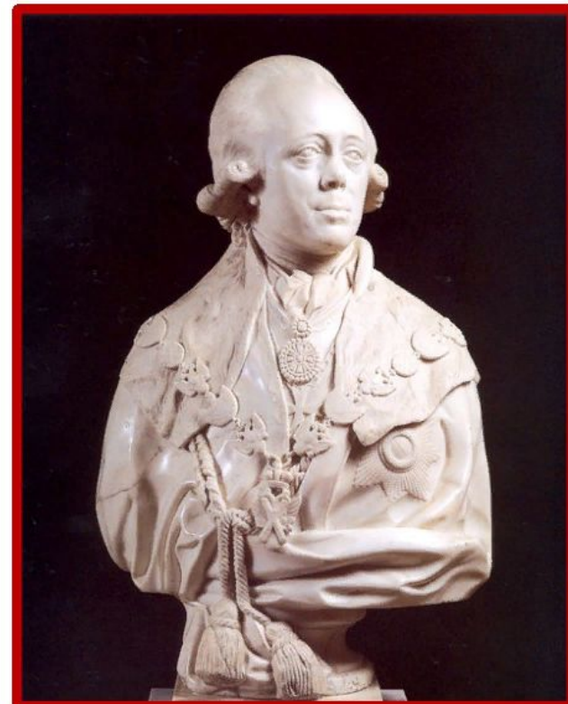
Шубин Ф. И. Бюст императора Павла Петровича