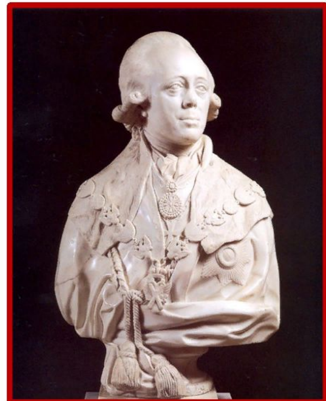
Шубин Ф. И. Бюст императора Павла Петровича