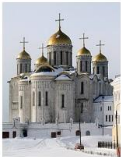
Успенский собор во Владимире