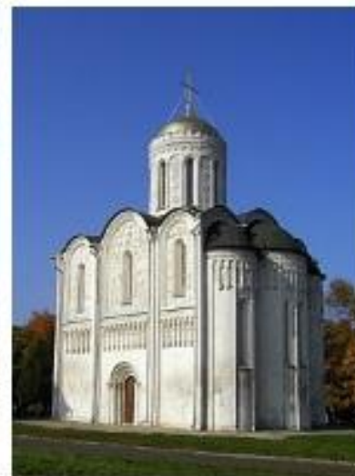
Дмитриевский собор во Владимире