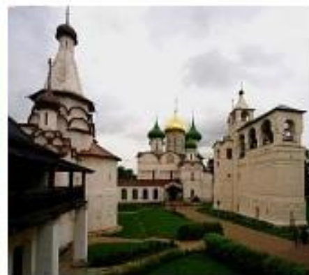
Спасо-Евфимиев монастырь в Суздале