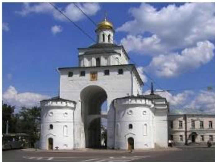
Золотые ворота во Владимире