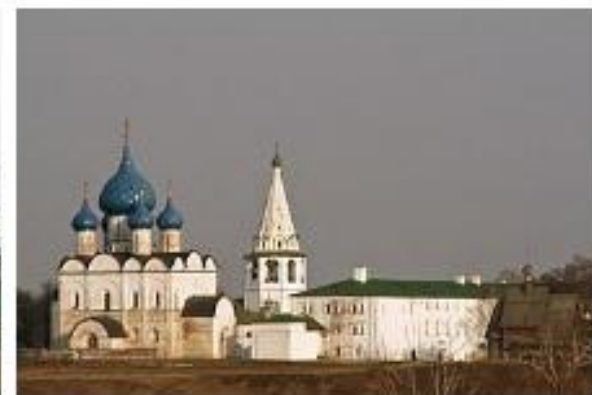
Суздальский кремль с Рождественским собором