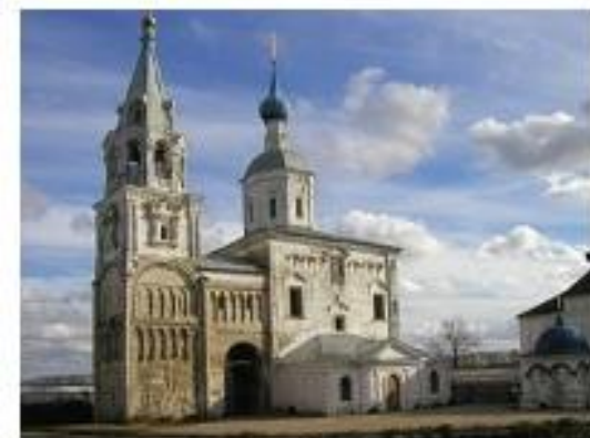
Дворец Андрея Боголюбского в Боголюбове