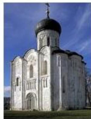
Церковь Покрова на Нерли близ Боголюбова