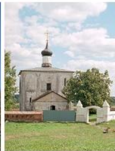
Церковь Бориса и Глеба в Кидекше