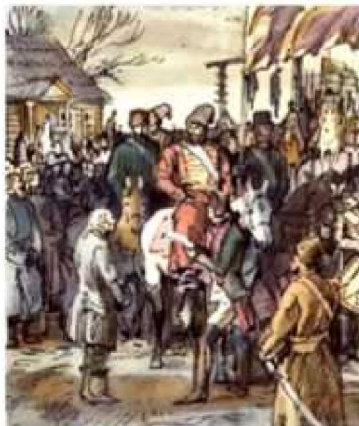
«Реестр барскому добру, разграбленному злодеями».

Савельич, видя благоволение Пугачёва к Гринёву, попытался получить награбленные вещи, но это ему не удалось.