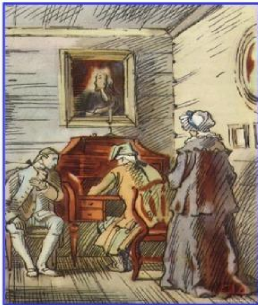
Художник А. Иткин

«Я не сводил глаз с пера батюшкина, которое двигалось довольно медленно».