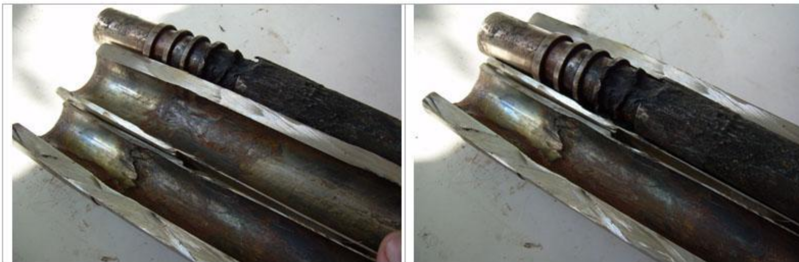
Рисунок 6 – Внешний вид цилиндра с поршнем