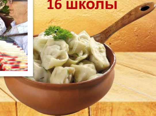
Выпускники 16 школы