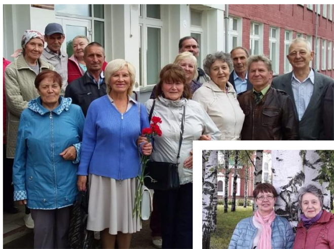
Выпускники Понинской школы- интерната

Кто такие Бликие люди? Это не только родные и друзья, за которых несешь ответственность. Это все ученики, которые прошли через сердца учителей. Ученики интерната, которые уже сами стали бабушками и до сих пор приезжают в гости. Ученики школ, в которых мы