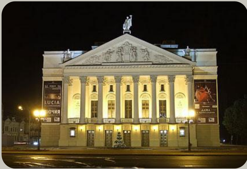
Муса Жәлил исемендәге Татар Дәүләт Опера һәм Балет театры Төзелгән елы: 1939