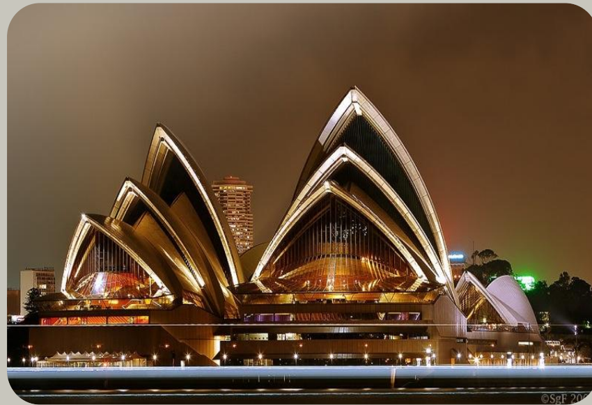
Sydney Opera House Founded:1959