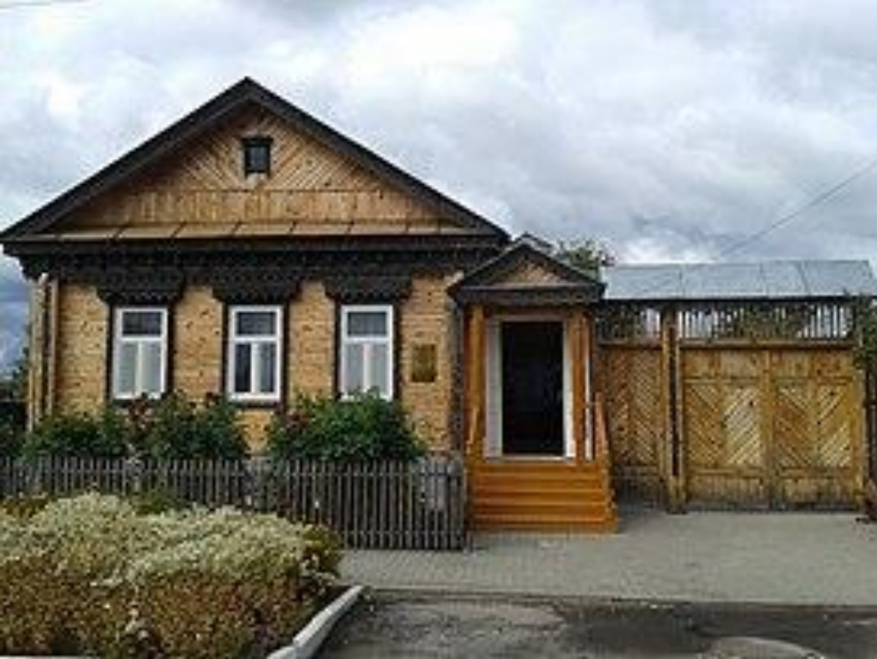
Александр Иванович Куприн