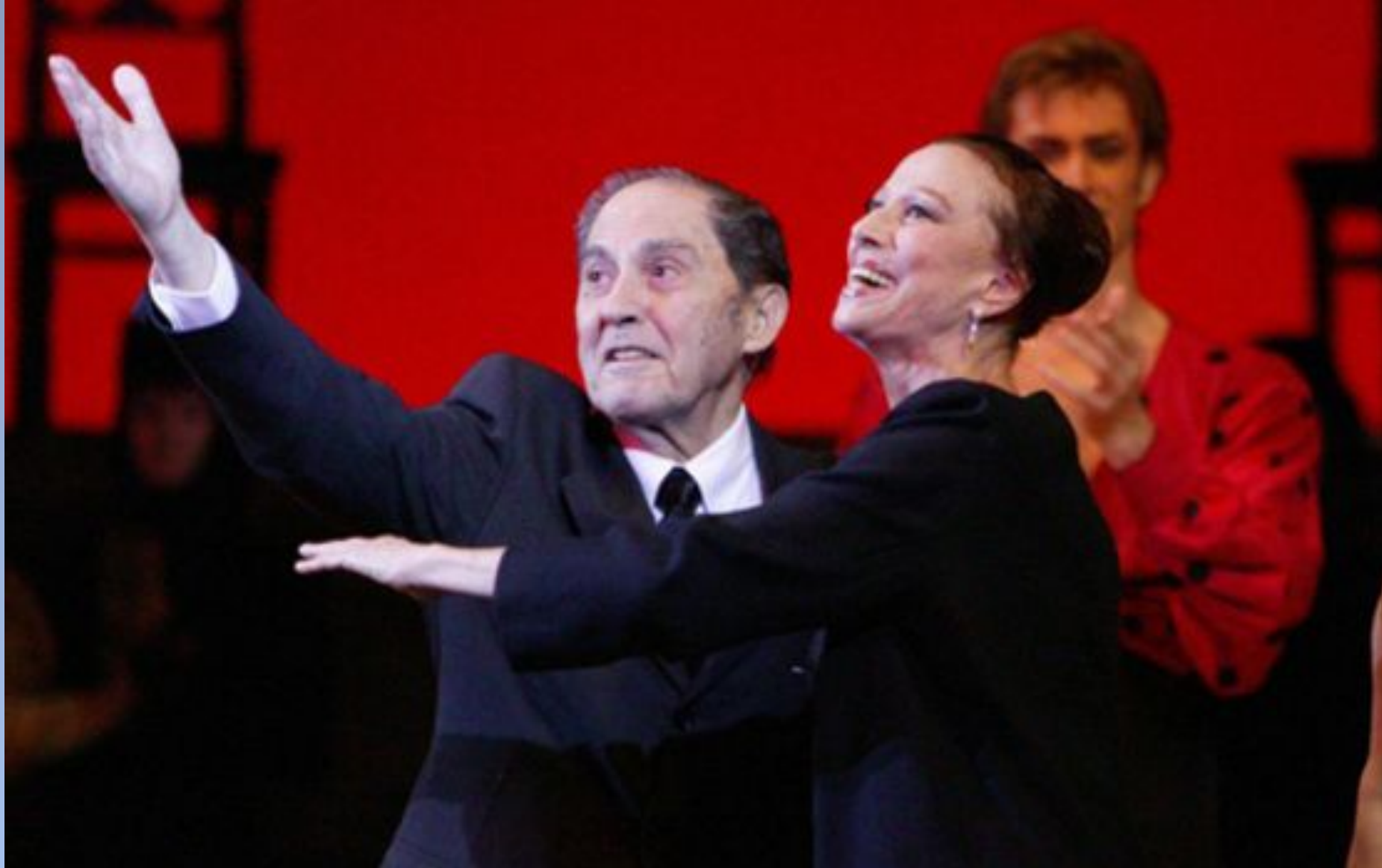
М. Плисецкая и А. Алонсо