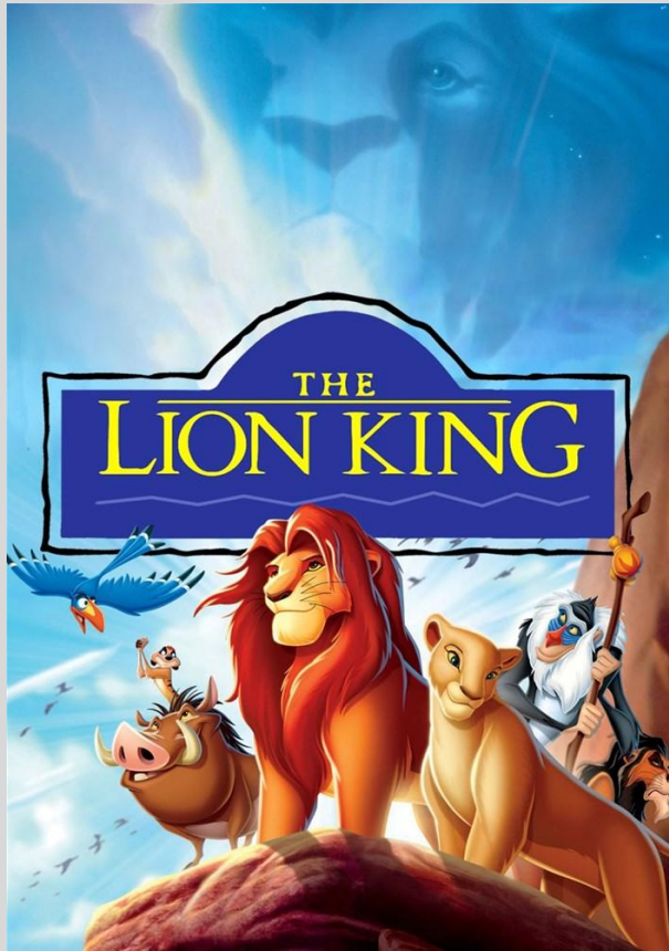
«Король лев» (1994)