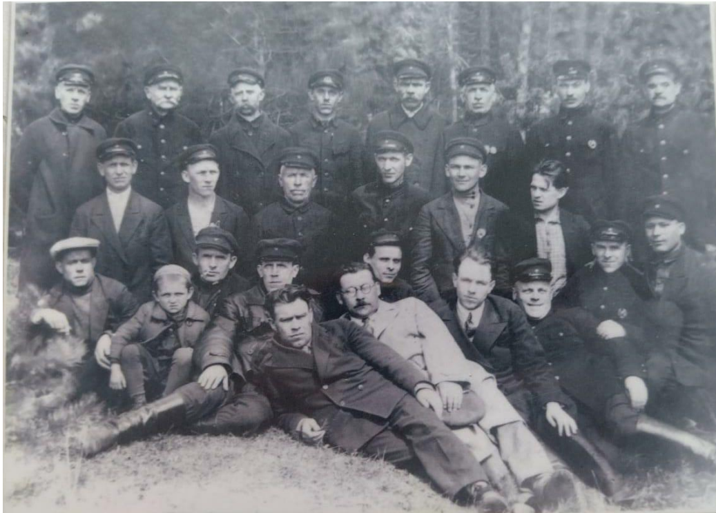
Прадедушка в партизанском отряде, 2 ряд, 2 слева

После окончания войны и возвращения с концлагеря семья узнала, что мой прадед в 1943 году пропал без вести.