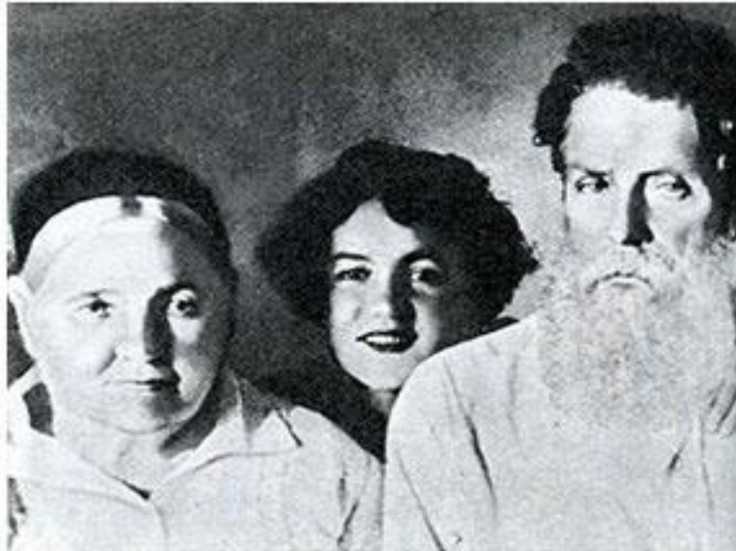
Довженко з батьком (ліворуч). Мати, сестра та батько Довженка (праворуч).