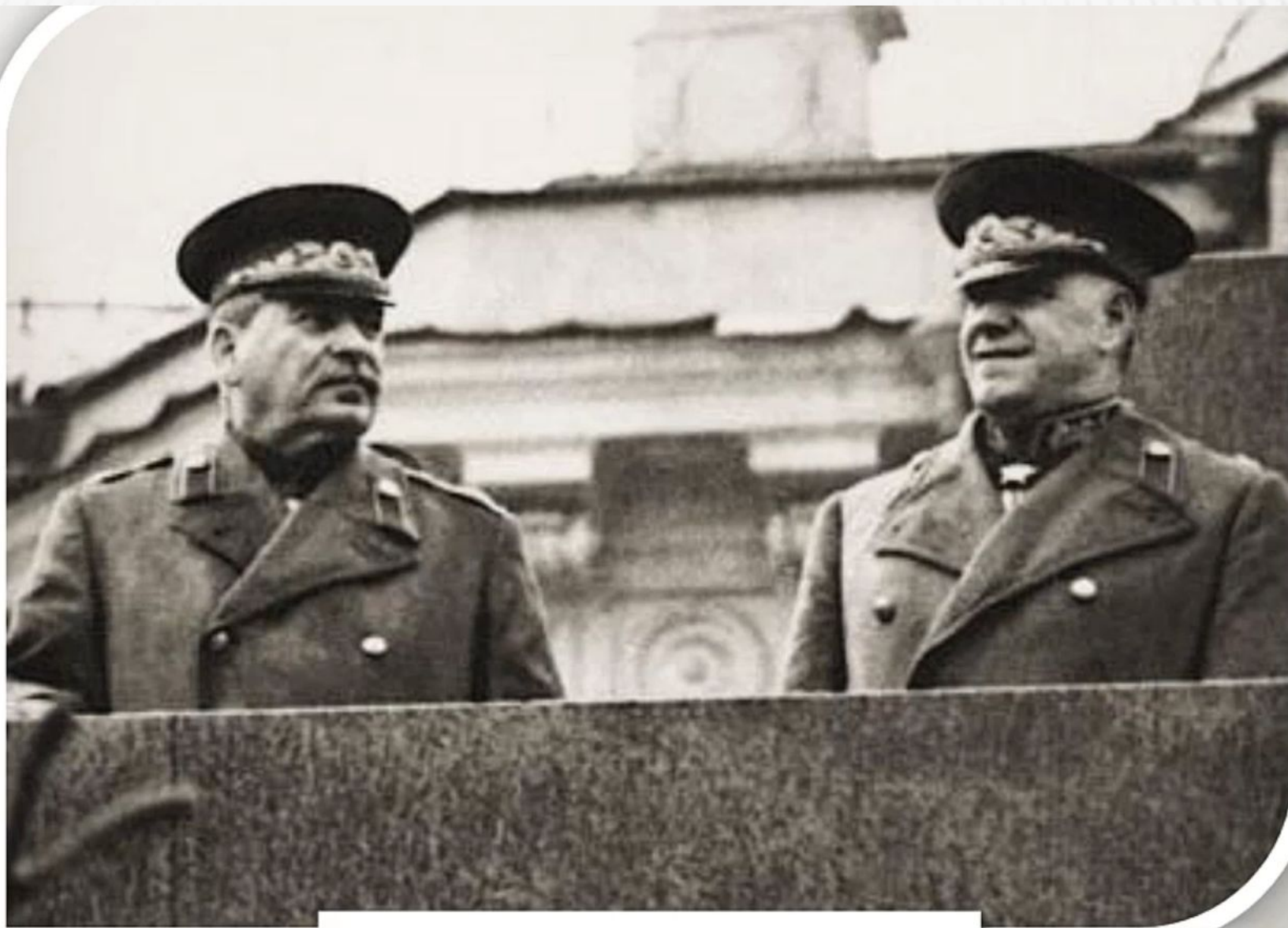
И. Сталин и Г. Жуков