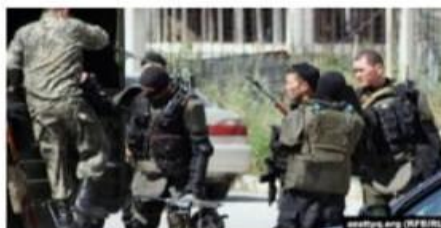
Хроника терактов в Казахста... rus.azattyq.org