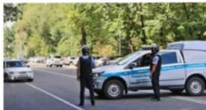
Хроники террора в Казахстане... ru.sputnik.kz