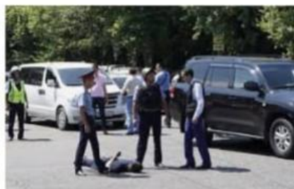
Противодействие терроризм... ritmeurasia.org