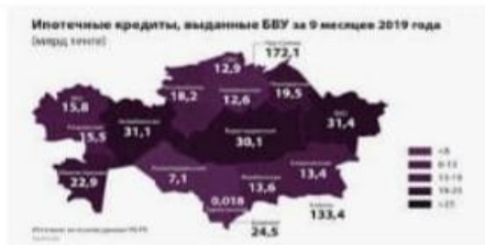
Объем ипотечных кредитов в... banker.kz