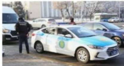
Полиция Казахстана перешла... tengrinews.kz