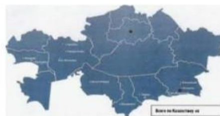
Токкожин К.Б. ПРАВОВЫЕ И О... aui-aktobe.kz