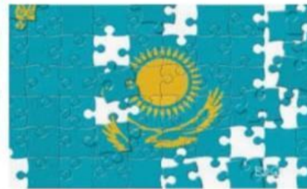
Проблема терроризма в Каза... regnum.ru