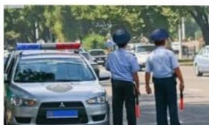
Закон на дороге. За что и как... travel.drom.ru