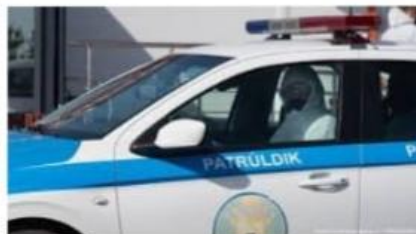
Чего ждать после 2 августа и... tengrinews.kz