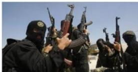
УГРОЗА ТЕРРОРИЗМА В КАЗ... ia-centr.ru