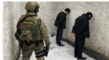
терроризм - Новости Казахст... 24.kz