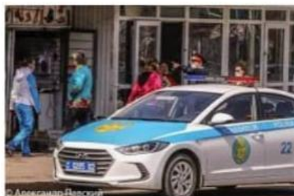
Когда в регионах Казахстана ... inform.kz