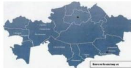
Токкожин К.Б. ПРАВОВЫЕ И О... aui-aktobe.kz