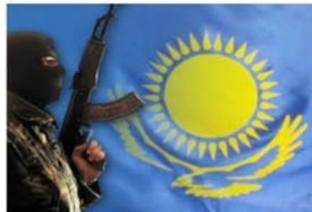
Россия и соотечественники - ... russkie.org