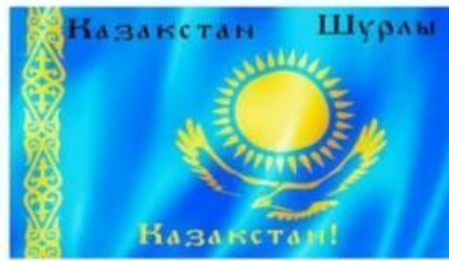
Казахстан | География вики | ... geografia.fandom.com