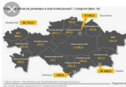
Больше вкладывать средств ... 24.kz