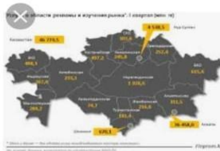
Больше вкладывать средств ... 24.kz