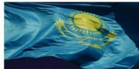
Зачем создали новые посоль... tenarinews.kz