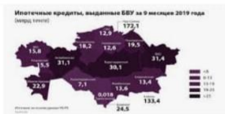
Объем ипотечных кредитов в... banker.kz