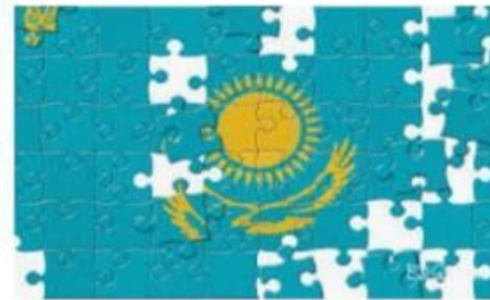
Проблема терроризма в Каза... regnum.ru