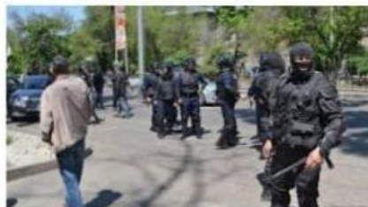
МВД Казахстана: В Актобе уб... dw.com