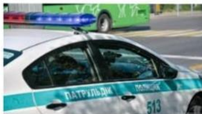
Житель Актобе тайно оформ... tengrinews.kz