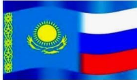
Россия и Казахстан объедини...