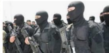
Новая госпрограмма: как вла... ru.sputnik.kz