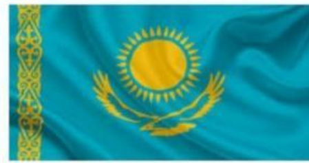
О мнимой «революции» в Каз... knews.kg