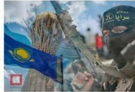
270 миллиардов тенге потрат... today.kz