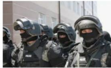
Почему в Казахстане не выпо... 365info.kz