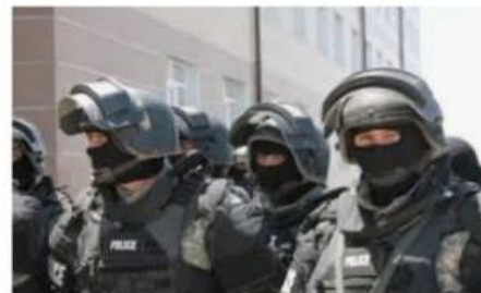
Почему в Казахстане не выпо... 365info.kz