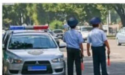
Закон на дороге. За что и как... travel.drom.ru