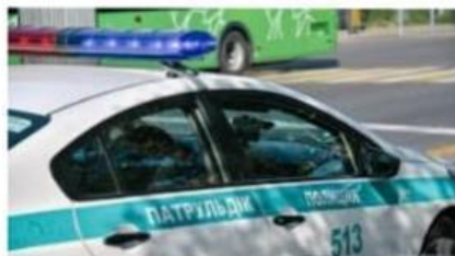
Житель Актобе тайно оформ... tengrinews.kz