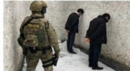
терроризм - Новости Казахст... 24.kz