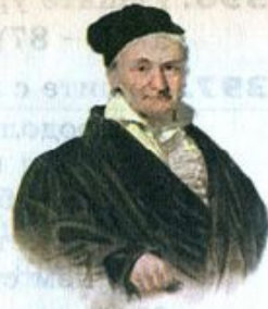
Карл Гаусс (1777—1855)

Немецкого учёного Карла Гаусса называли королём математиков. Его математическое дарование проявилось уже в детстве. Рассказывают, что в трёхлетнем возрасте он удивил окружающих, поправив расчёты своего отца с каменщиками. Однажды в школе (Гауссу в то время было 10 лет) учитель предложил классу сложить все числа от 1 до 100. Пока он диктовал задание, у Гаусса уже был готов ответ. На его грифельной доске было написано: 101 \cdot 50 = 5050 .