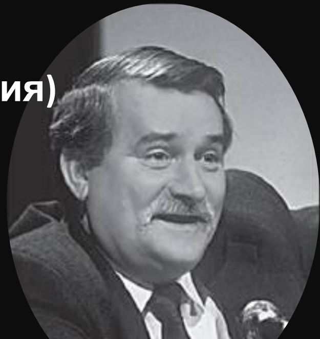
Электрик Гданьской судоверфи и глава профсоюза «Солидарность» Лех Валенса