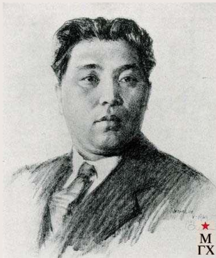
Ким Ир Сен (КНДР)