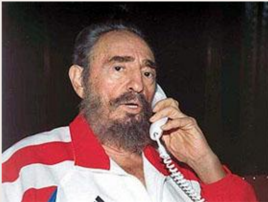
Фидель Кастро (Куба)