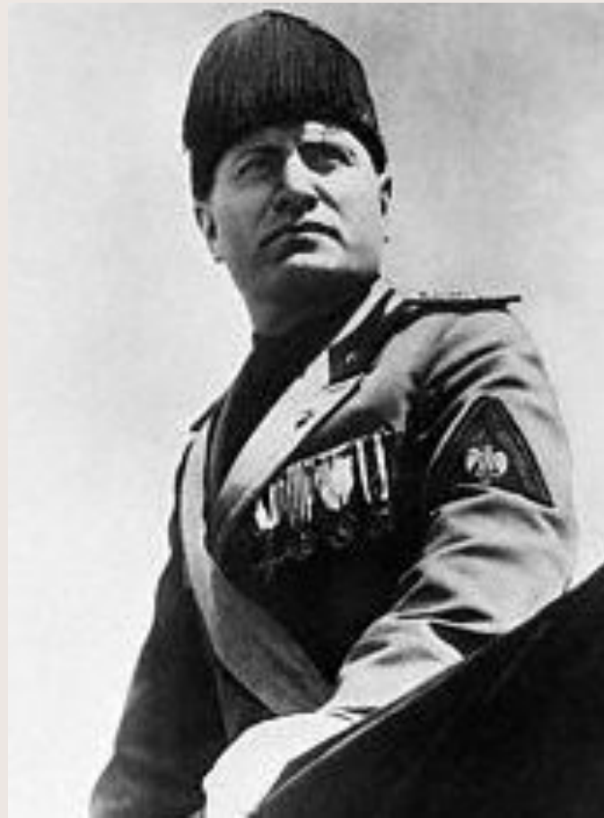
Бенито Муссолини (Италия)