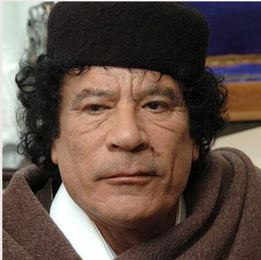
Муамар Каддафи (Ливия)