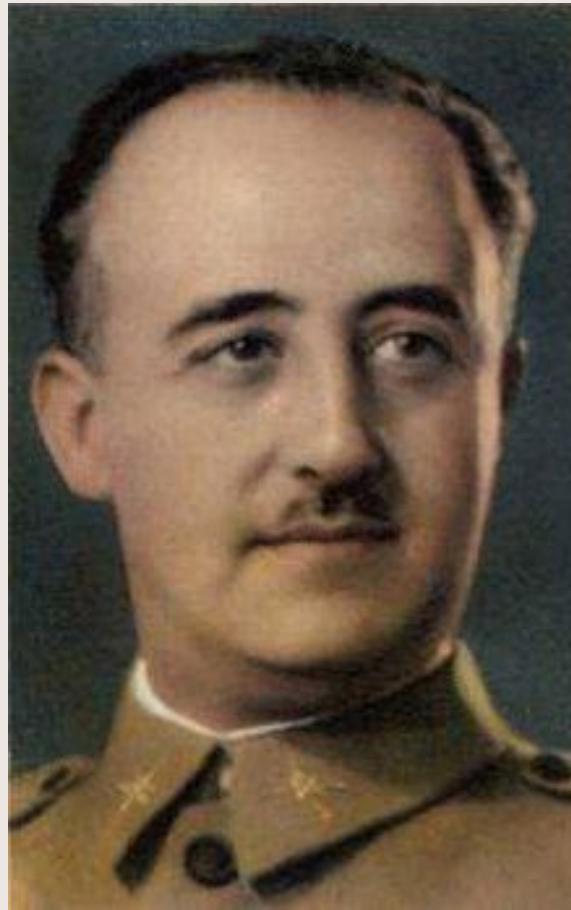
Франсиско Франко (Испания)