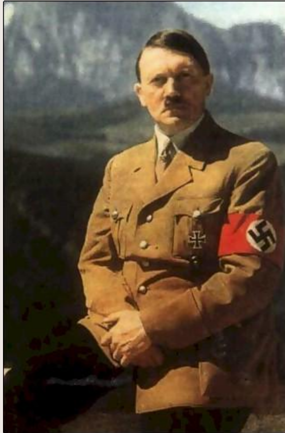
Адольф Гитлер (Германия)