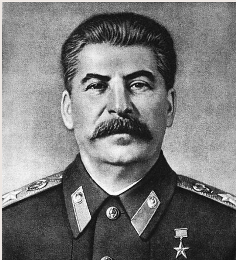
Иосиф Сталин (СССР)