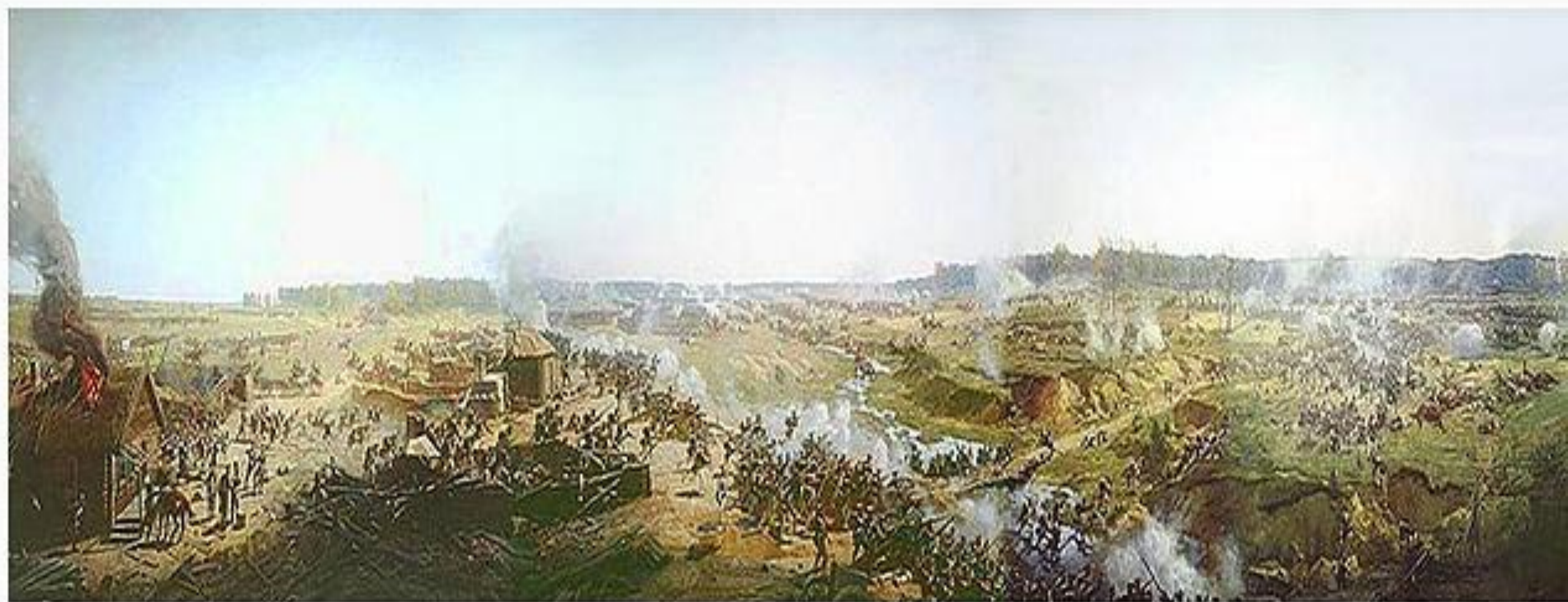
Бой за Семёновский овраг. Фрагмент панорамы Бородинского сражения Рубо (1912)

Сражение, продолжавшееся около 15 часов, стихло лишь в сумерки. Русские солдаты на протяжении всей битвы совершали подвиги беспримерного мужества. Российские офицеры проявили здесь свои лучшие качества.