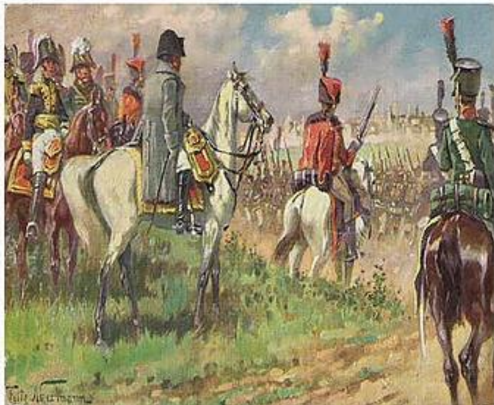
Открытка "1812 г. Наполеон под Москвой"