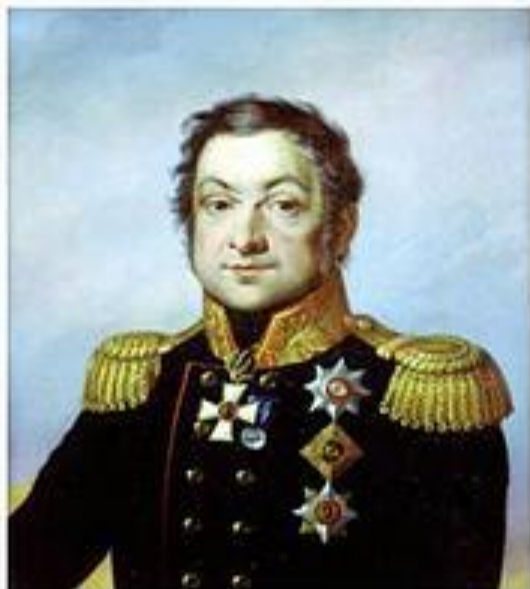
Д.С.Дохтуров. Художник Дж. Доу. 1819-1825 гг.

Кто первым произнес слова, ставшие знаменитыми благодаря Лермонтовскому стихотворению: «Москва за нами!»?