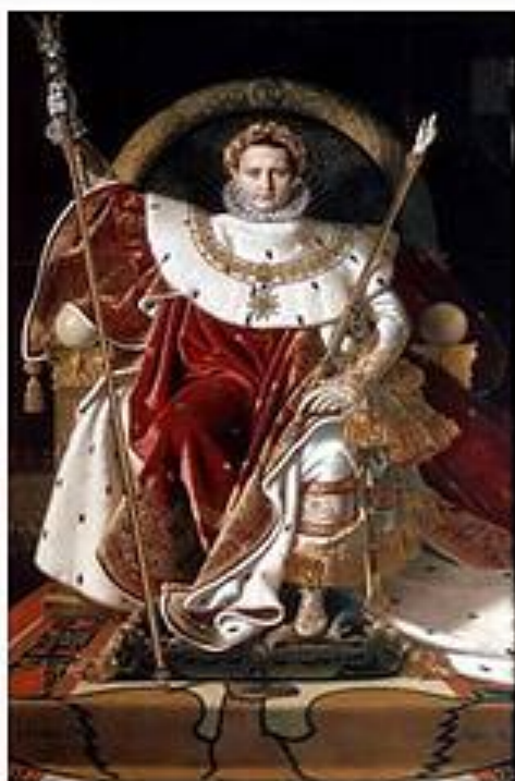
Энгр. Наполеон на императорском троне. 1806

К 1812 году император французов Наполеон I покорил и подчинил своему влиянию почти все страны Европы. Его Великую армию в России называли армией «двунадесяти языков». Но для русского солдата все они были «французами».