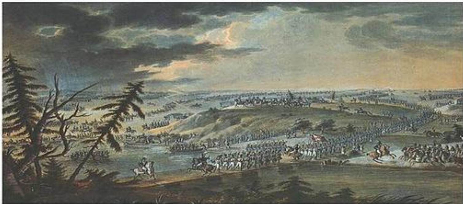
Переправа наполеоновской армии через Неман. 22 июня 1812. Неизвестный художник.

Вторжение войск Наполеона в пределы Российской империи началось в ночь на 12 (24) июня 1812 года. Общая численность неприятельской армии в этот момент составляла более 670 тыс. человек при 1372 орудиях. Наполеон рассчитывал закончить военную кампанию против России за 1-2 месяца.