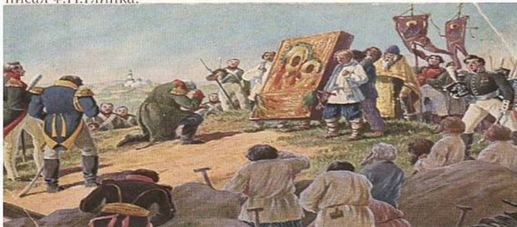
Зворыкин Б.В. "Молебен на позициях перед Бородинской битвой". 1912 г.

В русском стане после полудня вдоль фронта войск крестным ходом с чудотворной иконой Смоленской Божией Матери. Первым к образу покровительницы России, опустившись на колени, приложился М.И.Кутузов, и затем «сама собою, по влечению сердца, 100-тысячная армия падала на колени и припадала челом к земле, которую готова была упоить до сытости своею кровью», — писал Ф.Н.Глинка.