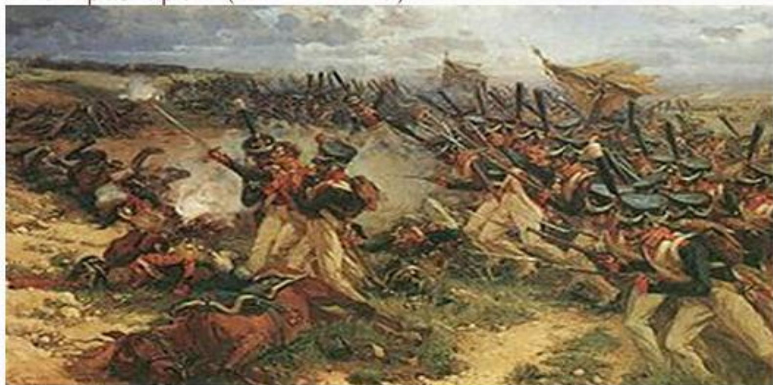
Атака лейб-гвардии Литовского полка из 5-го пехотного корпуса. Самокиш

Битва началась ранним утром 26 августа (7 сентября). Около 6 часов раздался первый выстрел французского орудия.. Русская артиллерия открыла ответный огонь. «В рассветном воздухе шумела буря. Ядра... визжали пролетными вихрями над головами. Гранаты лопались. В пять минут сражение было уже в полном разгаре». (Ф.Н.Глинка)