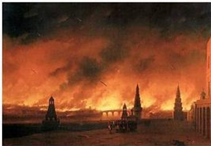
Пожар Москвы 1812 году. Картины неизвестного художника. XIX

В единоборстве с наполеоновскими войсками русские остались непобежденными — таков первый итог Бородинского сражения.