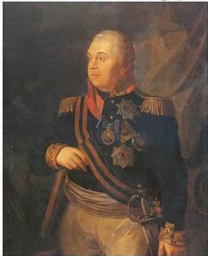
Волков Р.М. Портрет М.И. Кутузова. 1813 г

Общая численность российских вооруженных сил на Западной границе империи (разделенных на 3 армии) составляла около 317 тыс. человек при 1102 орудиях.