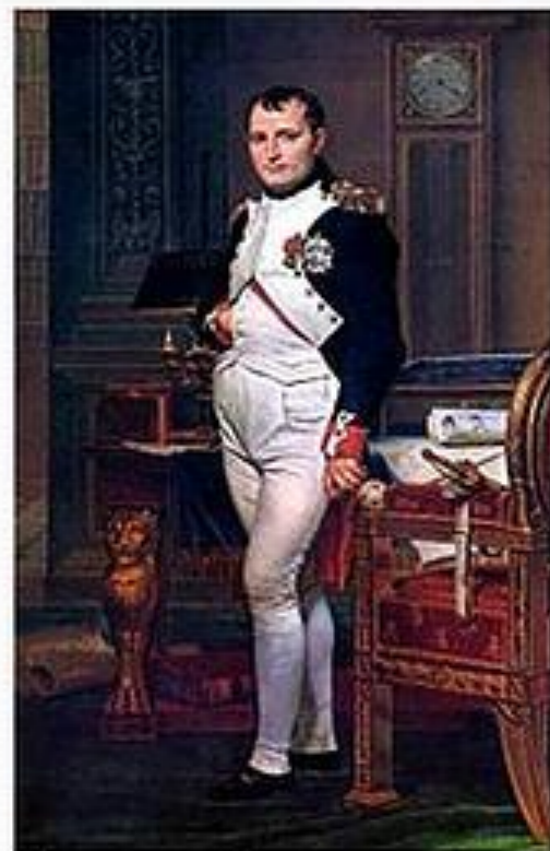
Император Наполеон в своем кабинете в Тюильри. Жак Луи Давид (1812)

(1769-1821, ) — император Франции в 1804—1815 годах, великий французский полководец и государственный деятель.