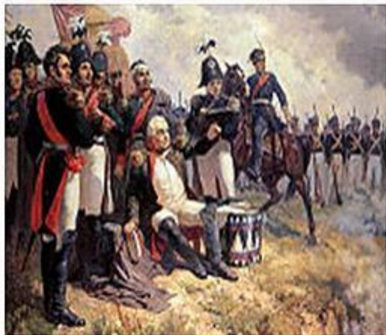
Кутузов на командном пункте в день Бородинского сражения. А. Шепелюк (1951)

В армии Наполеона на Бородинском поле насчитывалось около 135 тыс. солдат при 587 орудиях, в распоряжении Кутузова находилось около 114 тыс. солдат регулярных войск при 624 орудиях, около 10 тыс. ратников ополчения и около 8 тыс. казаков. Сражение при селе Бородино было невиданным по численности, потерям и упорству обеих сторон в достижении победы