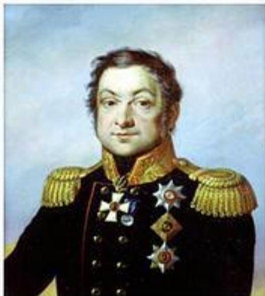
Д.С.Дохтуров. Художник Дж. Доу. 1819-1825 гг.

Кто первым произнес слова, ставшие знаменитыми благодаря Лермонтовскому стихотворению: «Москва за нами!»?