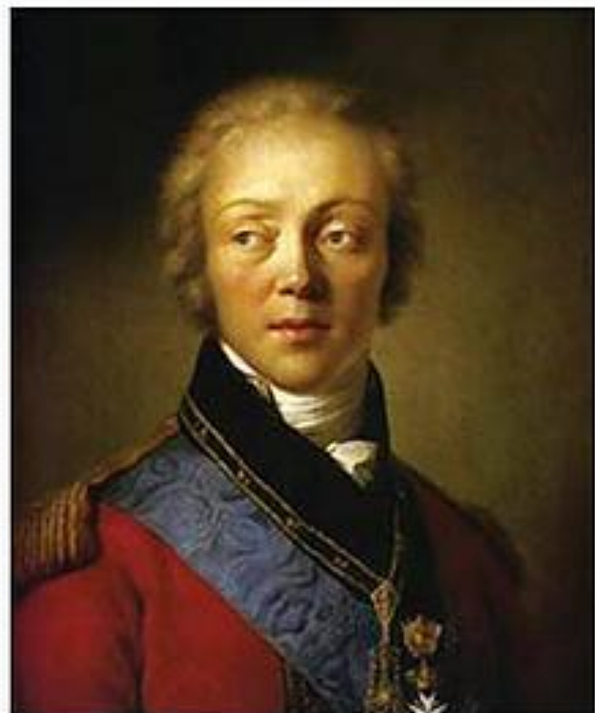
Ростопчин Фёдор Васильевич худ. С.Тончи, 1800 г.

Аглавнокомандующий Москвы Ф.В.Ростопчин говорил: «Москва была отдана за Россию, а не сдана на условиях. Неприятель не вошел в Москву — он был в нее впущен — на пагубу нашествия».