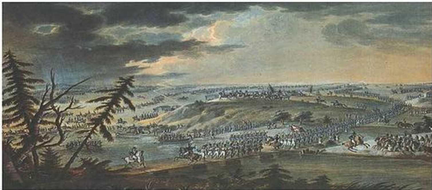
Переправа наполеоновской армии через Неман. 22 июня 1812. Неизвестный художник.

Вторжение войск Наполеона в пределы Российской империи началось в ночь на 12 (24) июня 1812 года. Общая численность неприятельской армии в этот момент составляла более 670 тыс. человек при 1372 орудиях. Наполеон рассчитывал закончить военную кампанию против России за 1-2 месяца.