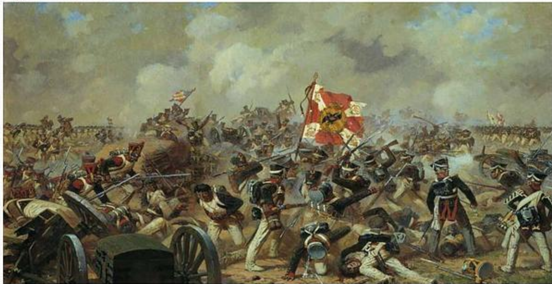
Бой за Багратионовы флеши Аверьянов Александр Юрьевич

Один из участников сражения веномичал: «Под Бородиным мы сошлись и етали колотьяся. Кодемся час, кодемся два... устали, руки опустились! И мы, и французы друг друга не трогаем, ходим как бараны! Которая-нибудь сторона отдохнет и ну опять колотьяся. Кодемся, кодемся, кодемся! Часа, почитай, три на одном месте кололись!»