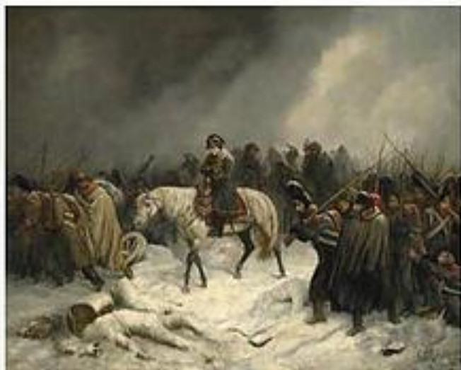
Отступление Наполеона из Москвы”, Адольф Нортерн, 1851 год.

Прошло немного времени, Наполеон вошел в сгоревшую Москву, а позже с остатками своей многоязычной армии в лютую русскую стужу покинул Россию.