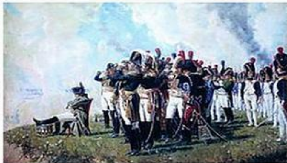
Наполеон на Бородинских высотах. Верещагин (1897)