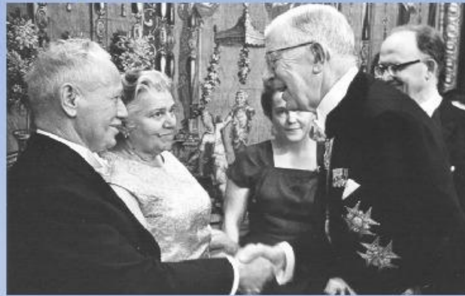
М.А. Шолохов и король Швеции Густав Адольф на церемонии вручения Нобелевской премии