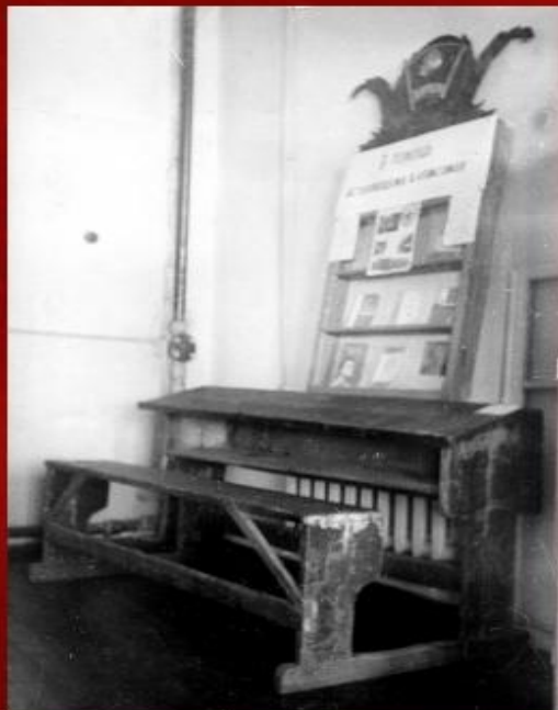
Парта, за которой сидел Шолохов в Каргинском училище.