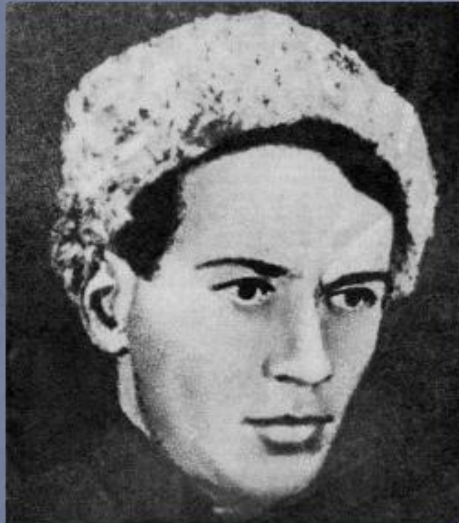
М. Шолохову 20 лет