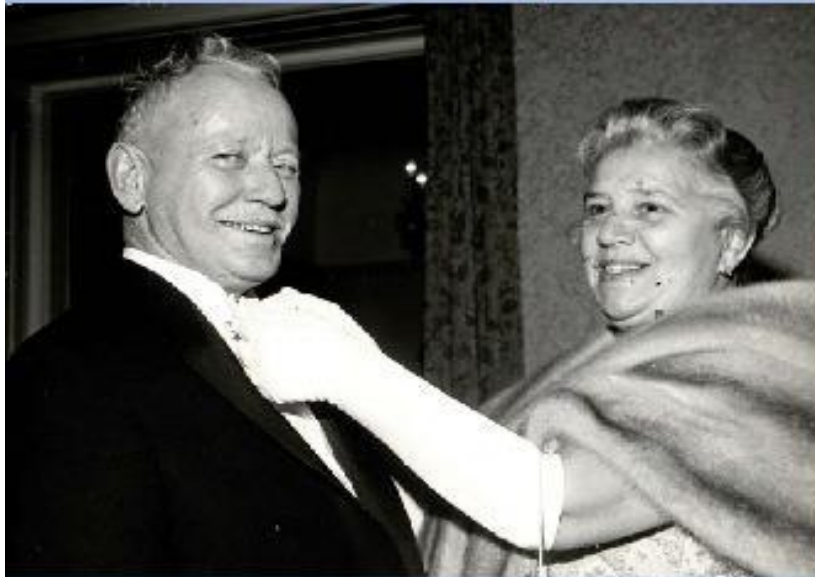
Супруги Шолоховы перед вручением Нобелевской премии.