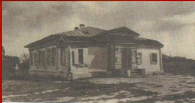
Каргинское приходское училище