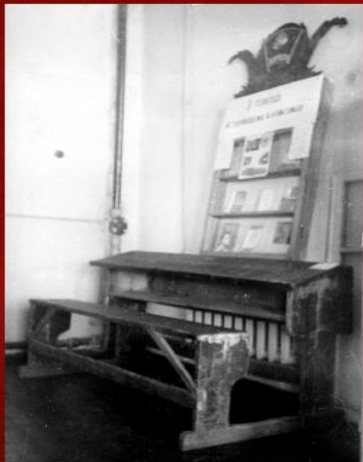
Парта, за которой сидел Шолохов в Каргинском училище.