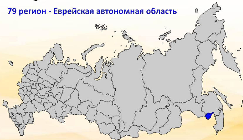
79 регион - Еврейская автономная область