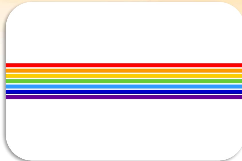
Флаг Еврейской АО