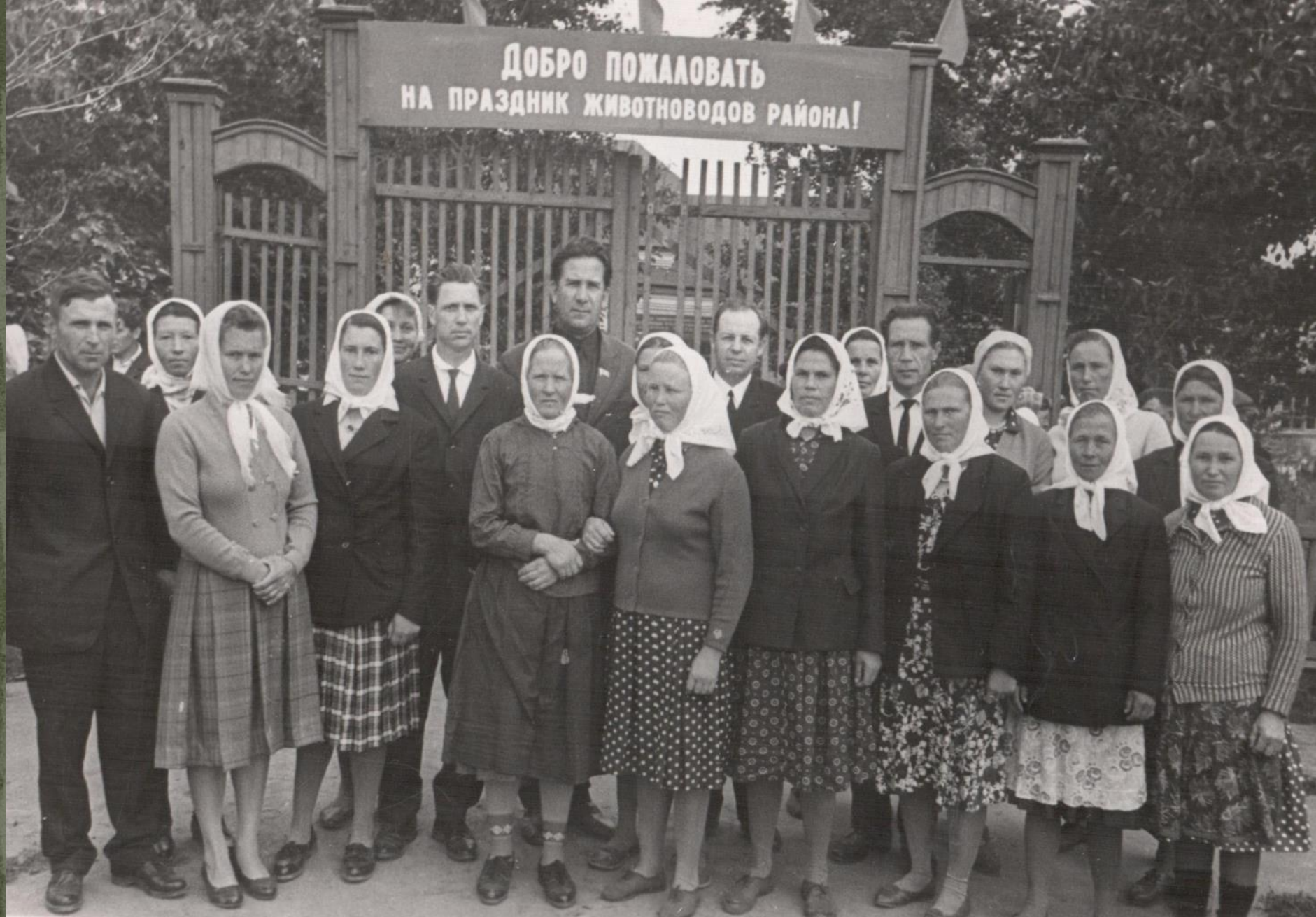
ДЕЛЕГАЦИЯ РАБОТНИКОВ ЖИВОТНОВОДСТВА КОЛХОЗА «СОВЕТСКАЯ РОССИЯ» . г. КРАСНОСЛОБОДСК. 10 июля 1968 г.