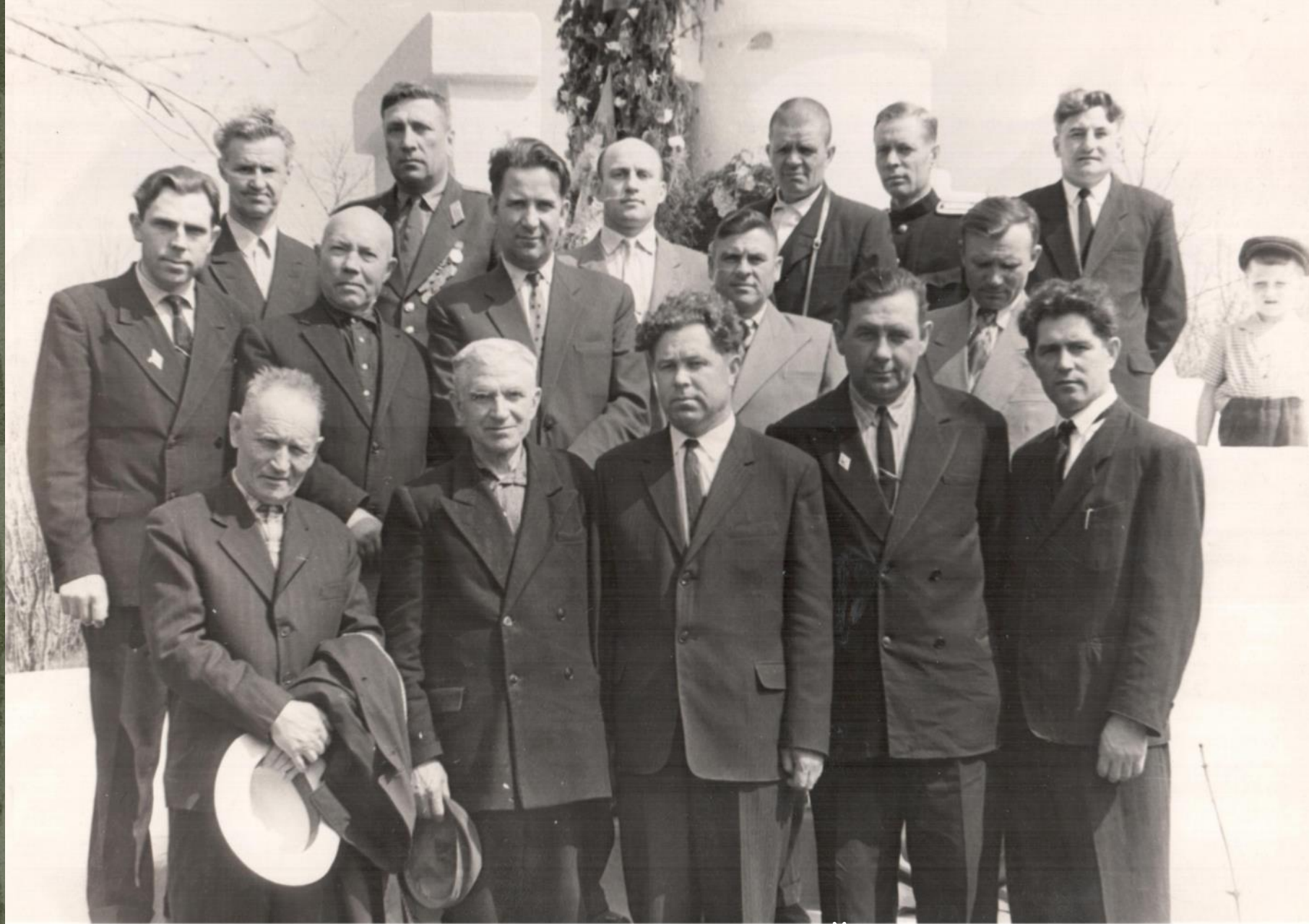
ЧЛЕНЫ БЮРО РК КПСС С ГРУППОЙ ПАРТАКТИВА. г. КРАСНОСЛОБОДСК. 1 мая 1964 г.