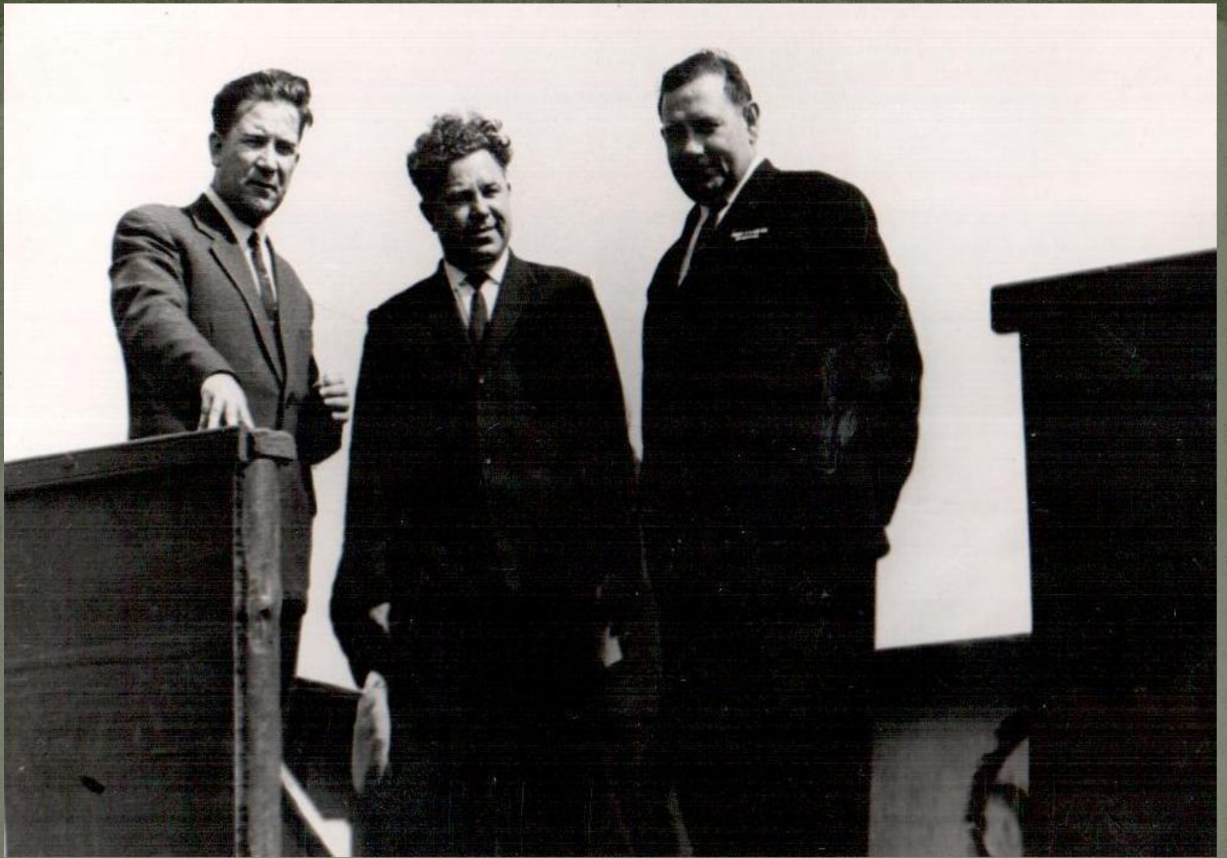
Г. КРАСНОСЛОБОДСК. 1960 Г.