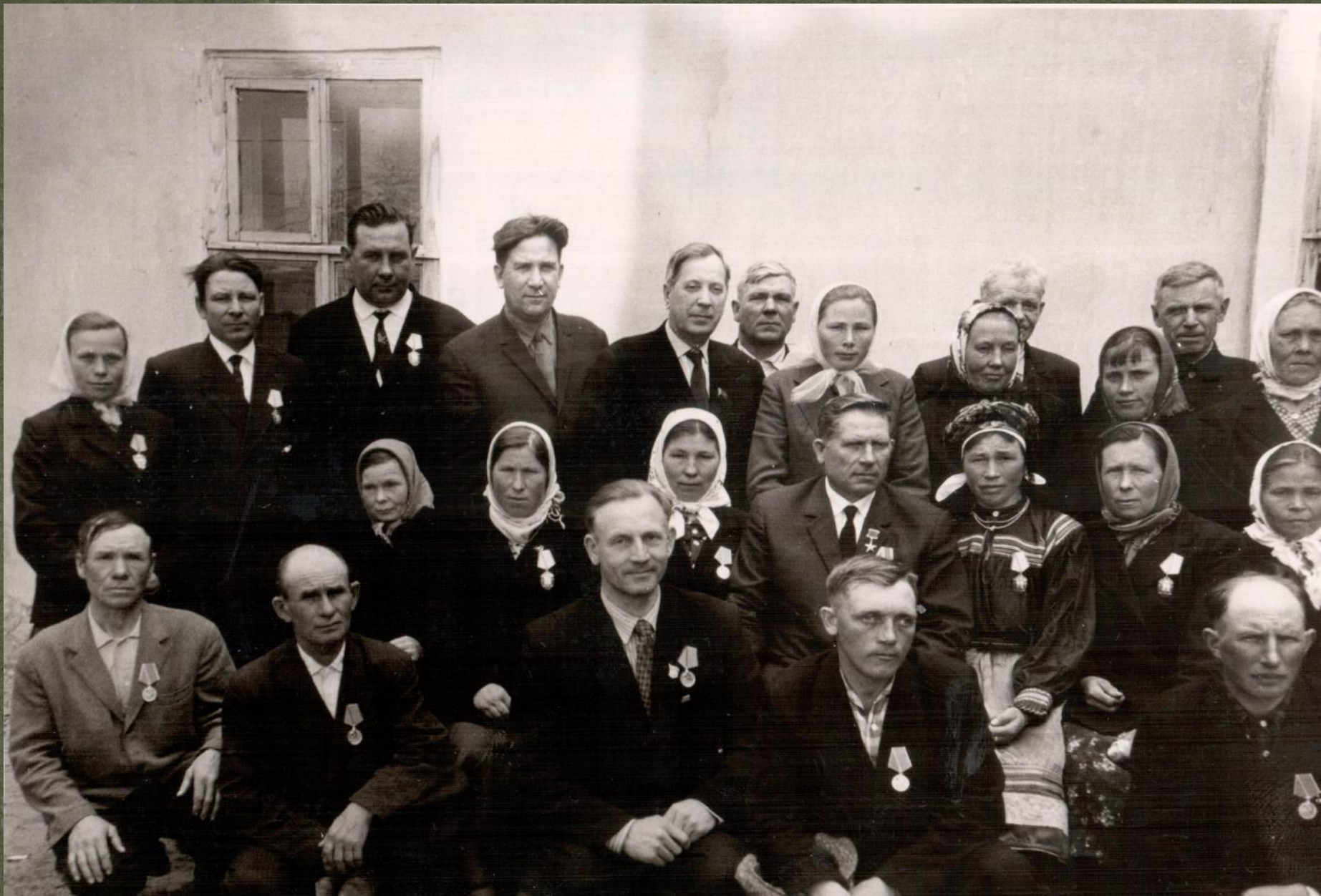
ПОСЛЕ ВРУЧЕНИЯ ГОСУДАРСТВЕННЫХ НАГРАД ПЕРЕДОВИКАМ С/Х ПРОИЗВОДСТВА. г. КРАСНОСЛОБОДСК. 28 апреля 1966 г.