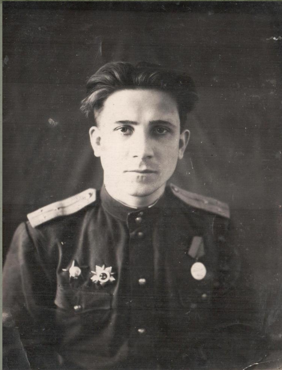
Г. КЕНИНГСБЕРГ. 1946 г.