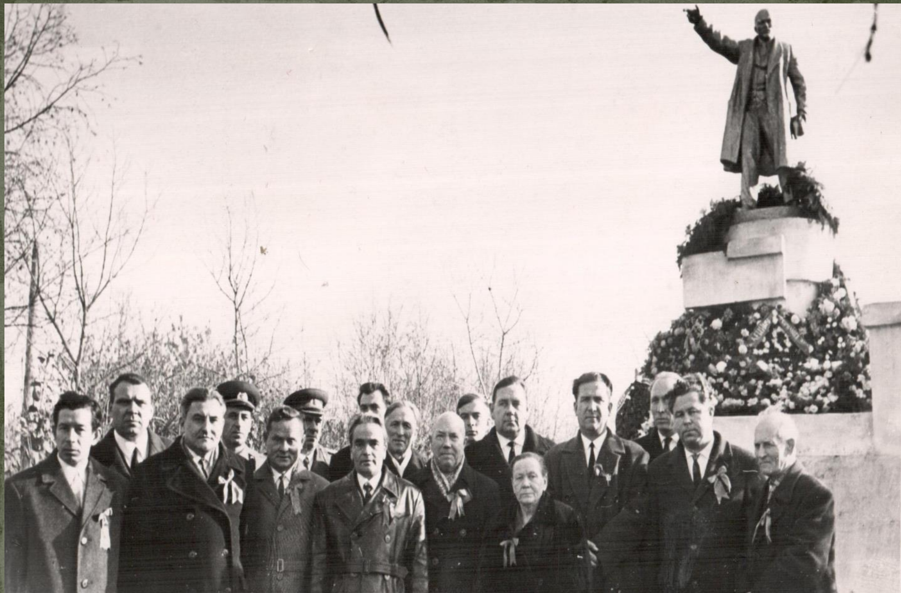
НА ПЕРВОМАЙСКОЙ ДЕМОНСТРАЦИИ. г. КРАСНОСЛОБОДСК. 1964 г.