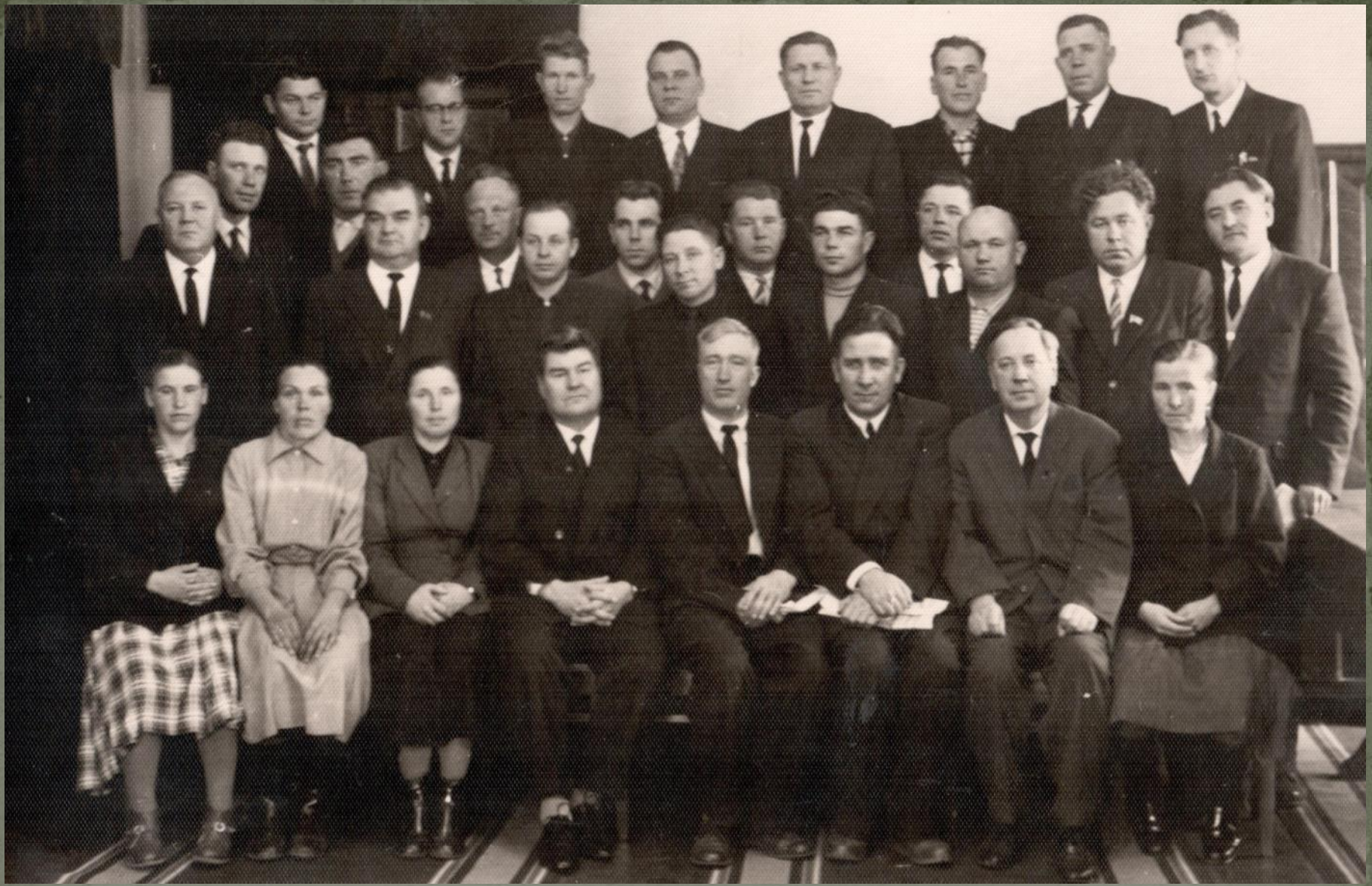
ДЕЛАГАТЫ ОБЛАСТНОЙ ПАРТКОНФЕРЕНЦИИ ОТ КРАСНОСЛОБОДСКОЙ РАЙОННОЙ ПАРТИЙНОЙ ОРГАНИЗАЦИИ. 21 ноября 1963 г.