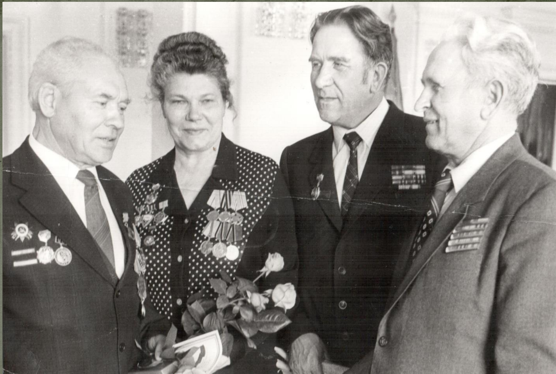
АКТИВ РЕСПУБЛИКАНСКОЙ ВЕТЕРАНСКОЙ ОРГАНИЗАЦИИ. г. САРАНСК. Начало 1980-х гг.