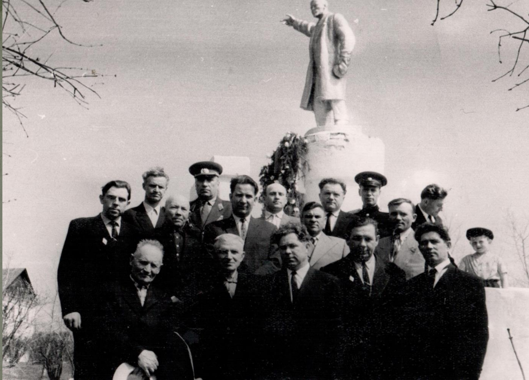
У ПАМЯТНИКА В.И. ЛЕНИНУ. г. КРАСНОСЛОБОДСК. 1 мая 1964 г.