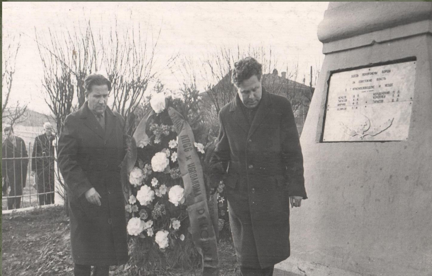
ВОЗЛОЖЕНИЕ ВЕНКА К ПАМЯТНИКУ ПОГИБШИМ КОММУНАРАМ. г. КРАСНОСЛОБОДСК. 3 ноября 1967 г.