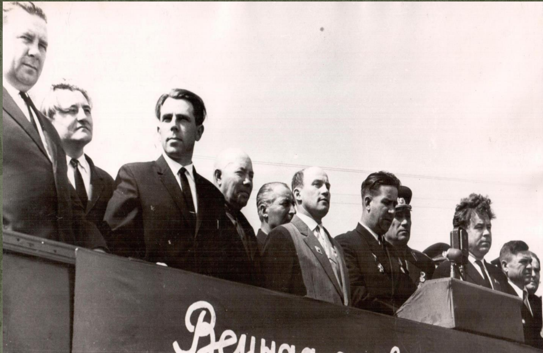
НА ОТКРЫТИИ ПАМЯТНИКА ПОГИБШИМ ВОИНАМ. г. КРАСНОСЛОБОДСК. 9 мая 1965 г.