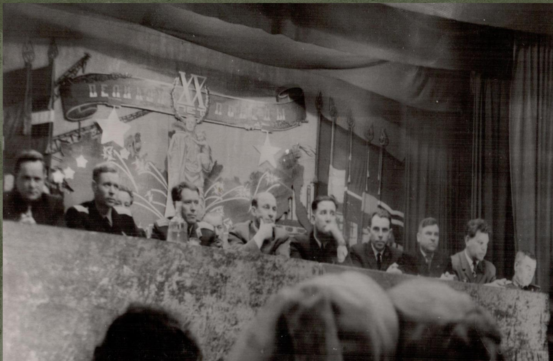
ПРЕЗИДИУМ ТОРЖЕСТВЕННОГО СОБРАНИЯ, ПОСВЯЩЕННОГО 20-летию ПОБЕДЫ. 8 мая 1965 г.