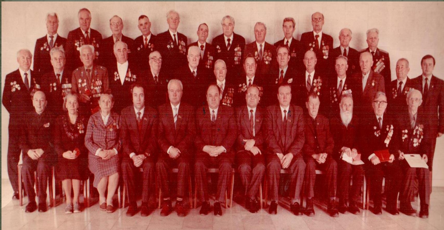
ВETERАНЫ ВОЙНЫ, ПАРТИИ И ТРУДА С ЧЛЕНАМИ БЮРО МОРДОВСКОГО ОК КПСС. Октябрь 1987 г.