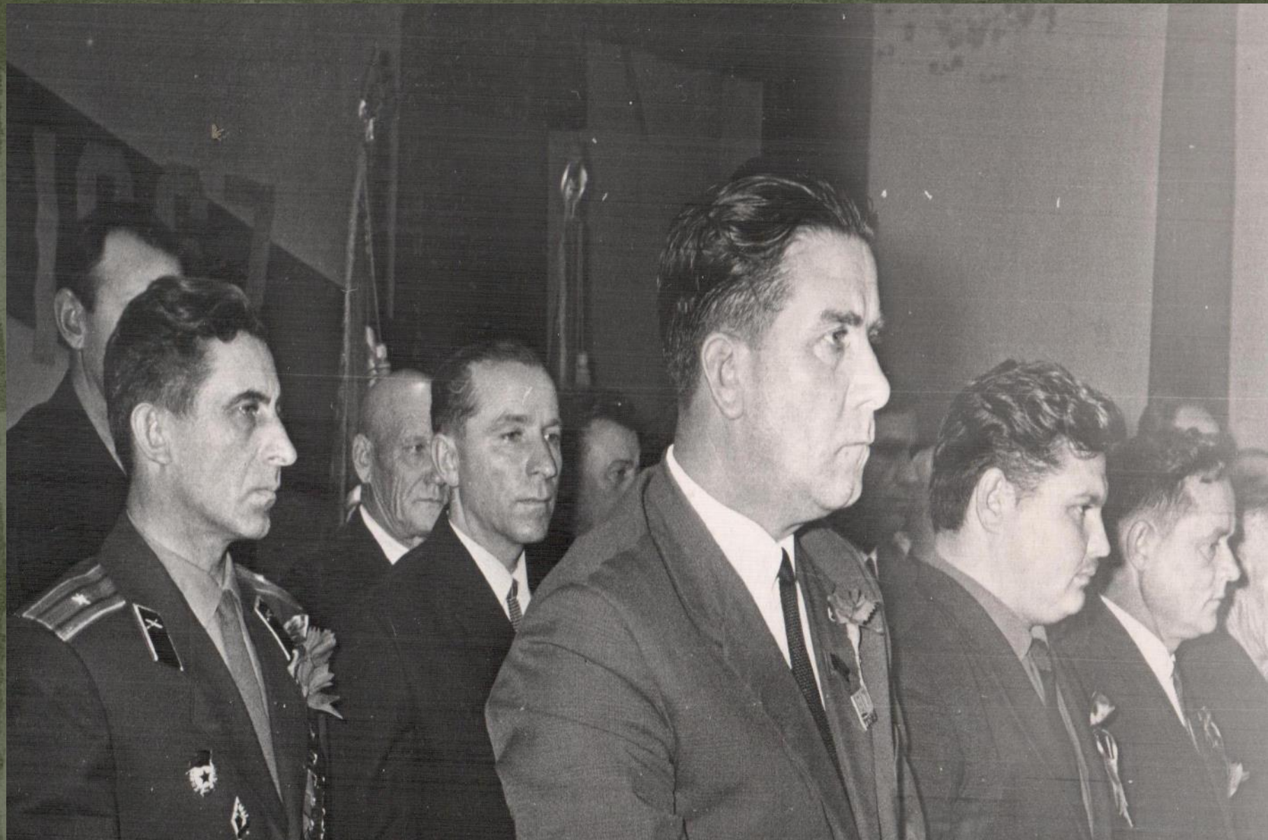
ПРЕЗИДИУМ ТОРЖЕСТВЕННОГО СОБРАНИЯ, ПОСВЯЩЕННОГО ПРАЗДНИКУ ВЕЛИКОГО ОКТЯБРЯ. г. КРАСНОСЛОБОДСК. 6 ноября 1969 г.