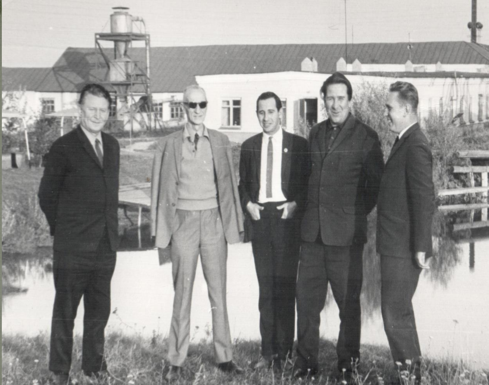
ЗАВОД «ПРОМСВЯЗЬ». ПРИЕЗД НАЧАЛЬНИКА ГЛАВНОГО УПРАВЛЕНИЯ МИНИСТЕРСТВА СВЯЗИ СССР А.Н. АРУТЮНОВА. Сентябрь 1969 г.