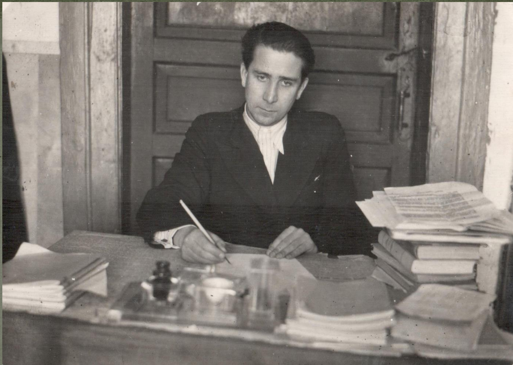
ДИРЕКТОР БОЛДОВСКОЙ СРЕДНЕЙ ШКОЛЫ. 1951 г.