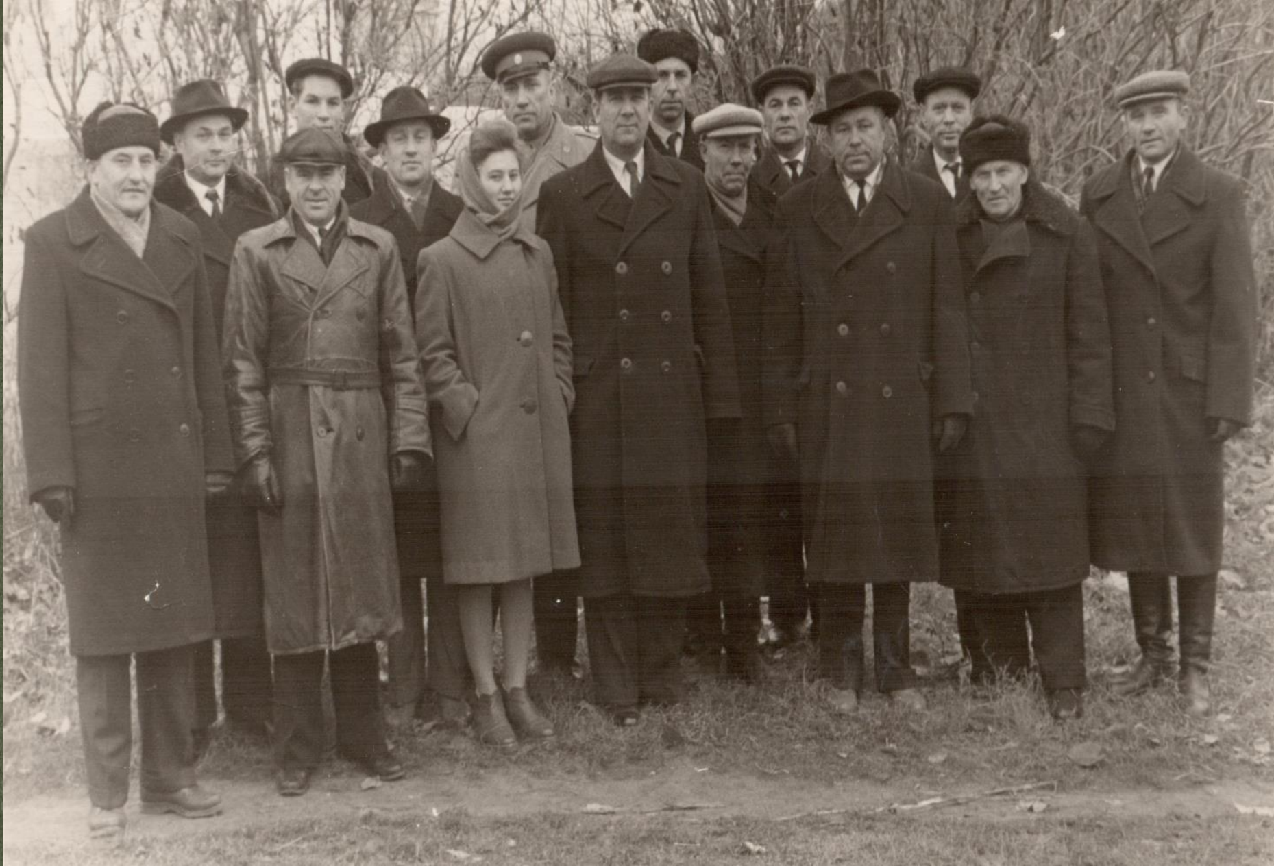
ГРУППА ПАРТИЙНОГО АКТИВА ПОСЛЕ МИТИНГА И ДЕМОНСТРАЦИИ ТРУДЯЩИХСЯ. г. КРАСНОСЛОБОДСК. 7 ноября 1964 г.