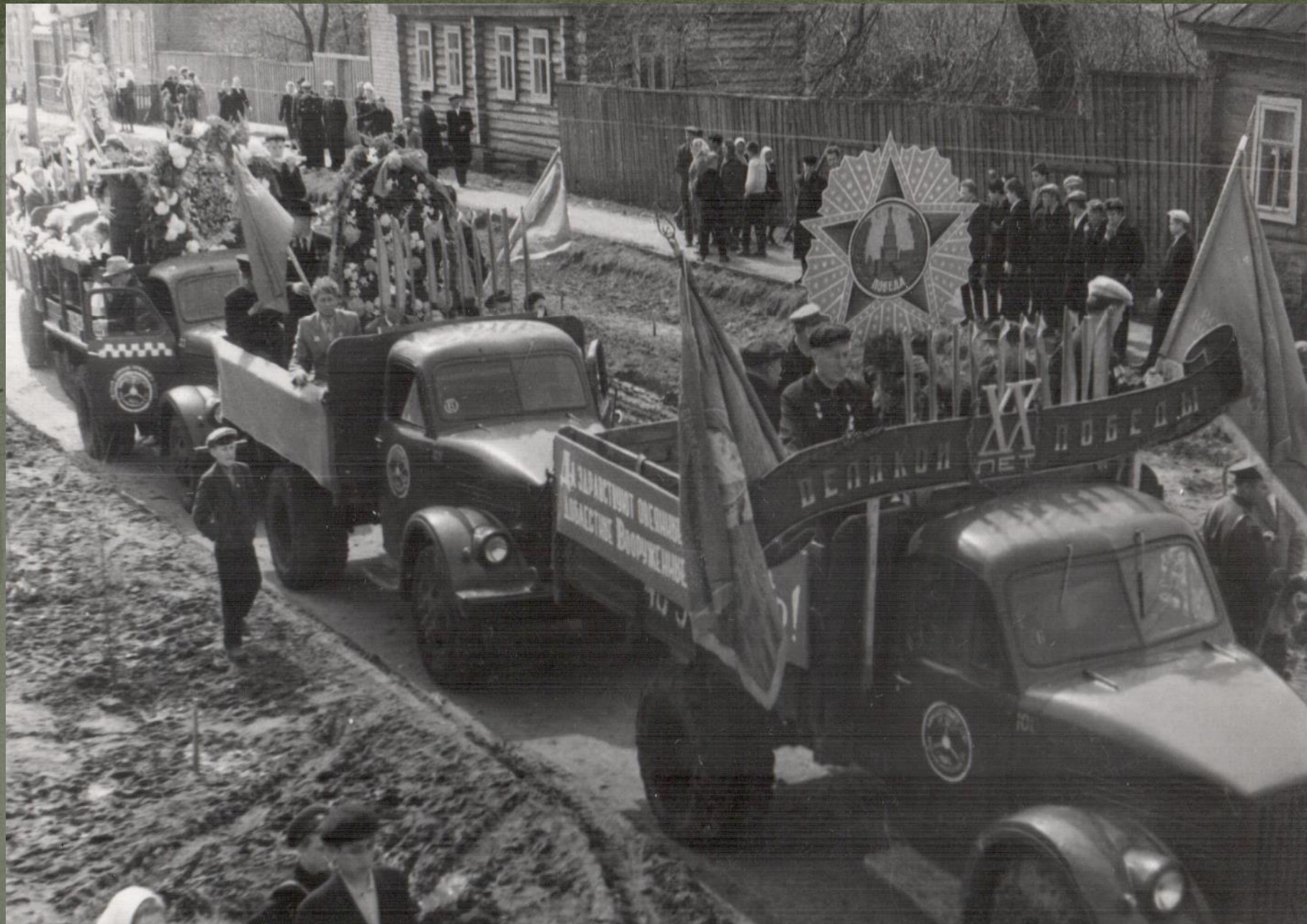
г. КРАСНОСЛОБОДСК. 9 мая 1965 г.