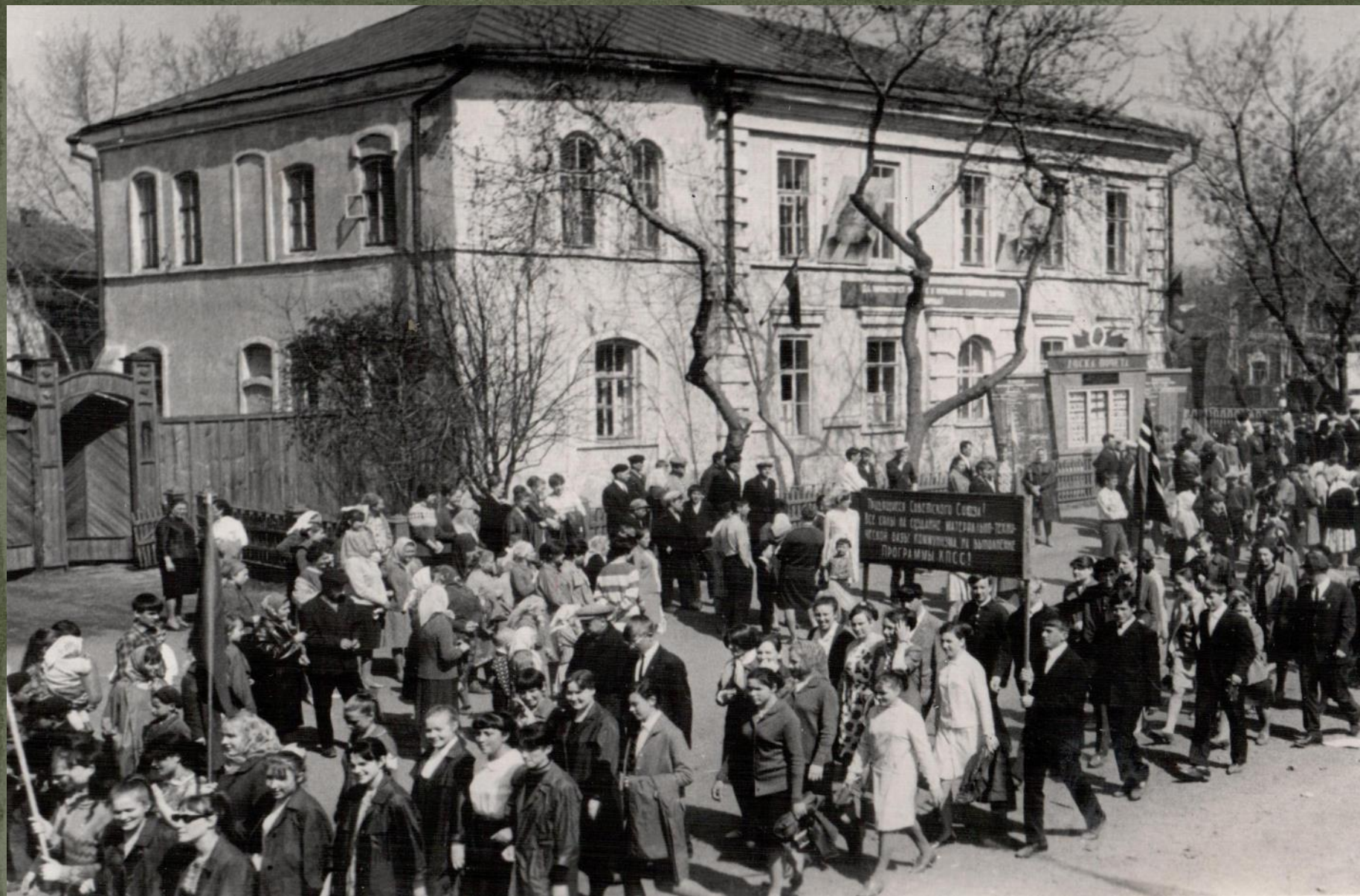
ПЕРВОМАЙСКАЯ ДЕМОНСТРАЦИЯ ТРУДЯЩИХСЯ. г. КРАСНОСЛОБОДСК. 1961 г.