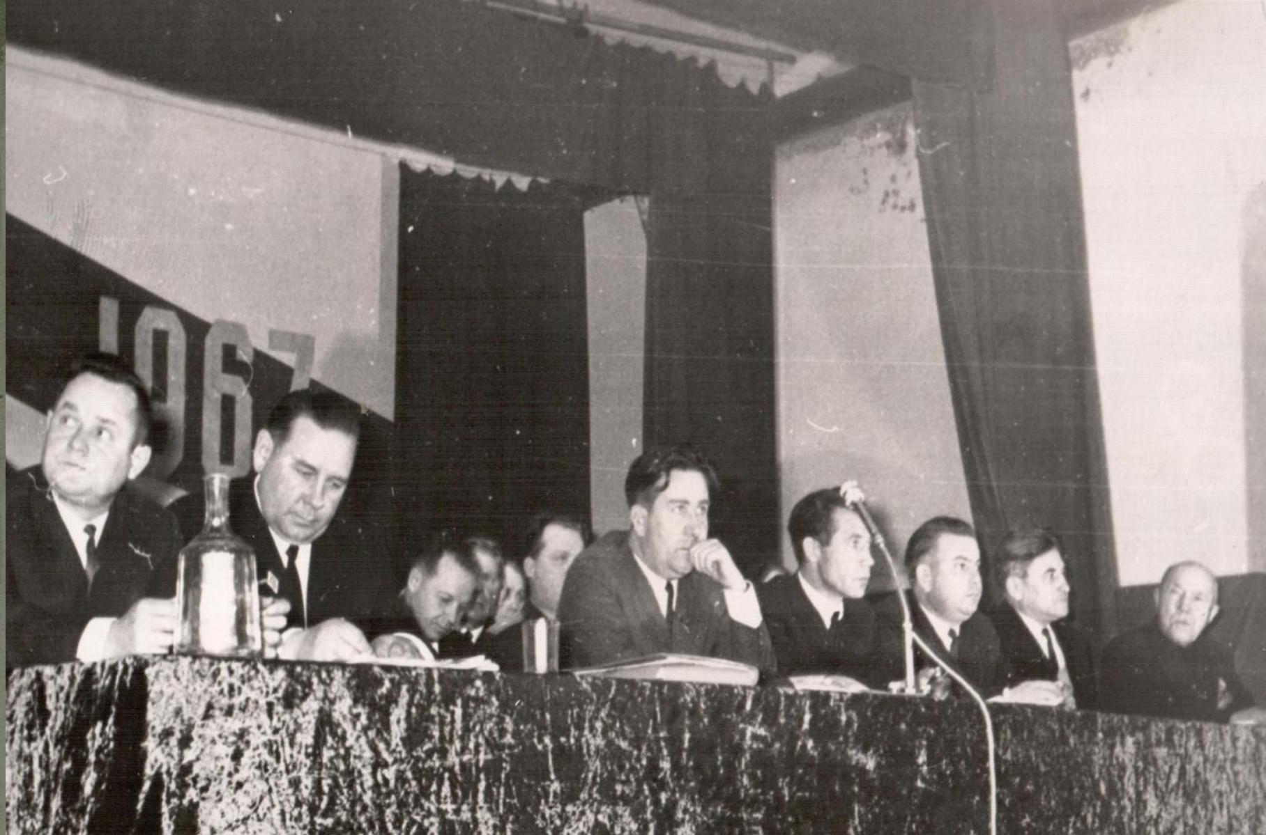
В ПРЕЗИДИУМЕ ТОРЖЕСТВЕННОГО ЗАСЕДАНИЯ, ПОСВЯЩЕННОГО 50-летию ВЕЛИКОГО ОКТЯБРЯ. г. КРАСНОСЛОБОДСК. 1967 г.