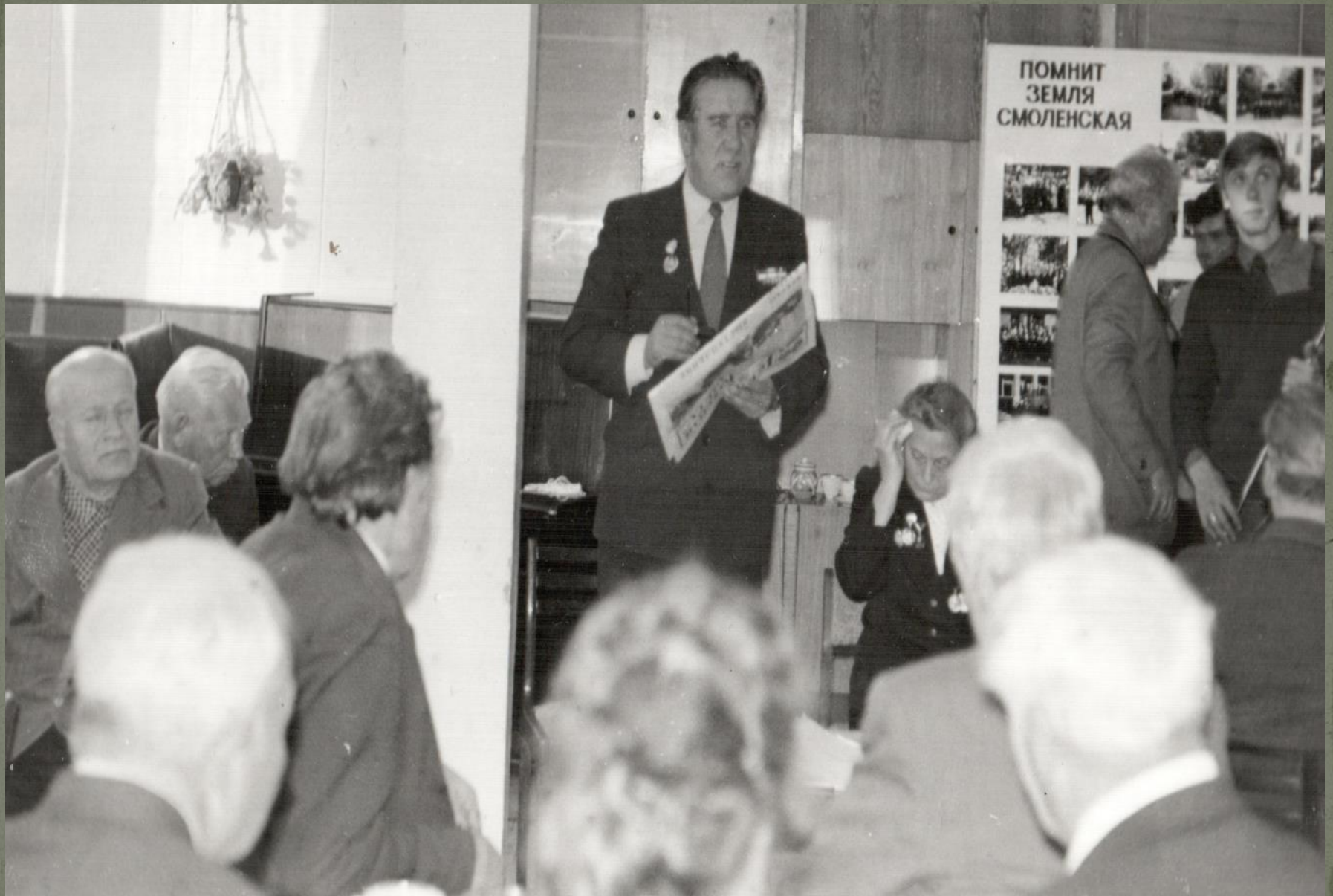
ОТКРЫТИЕ КЛУБА «ВЕТЕРАН». 22 октября 1983 г.