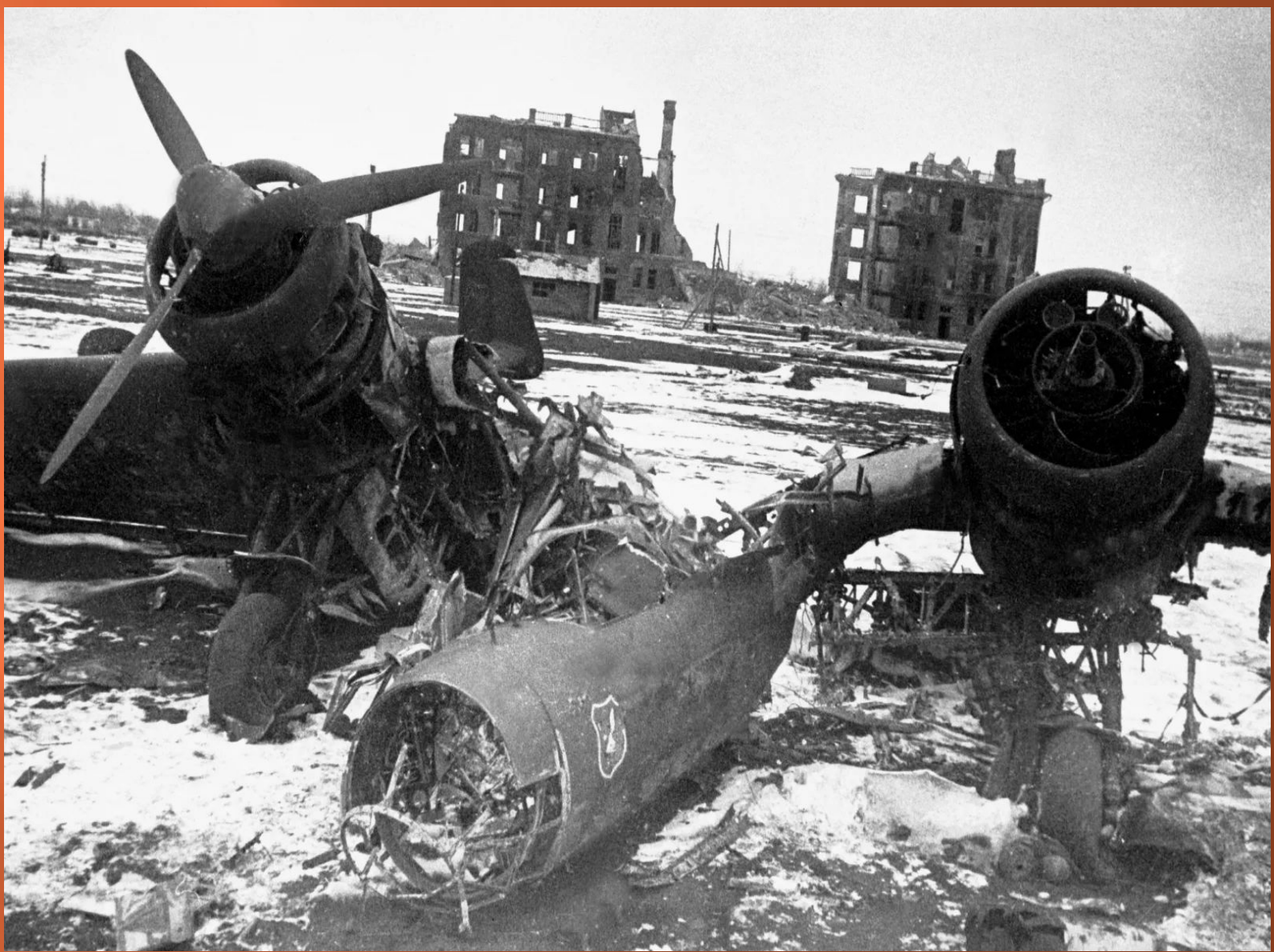
Немецкий самолёт - разведчик, уничтоженный на аэродроме Армавир.