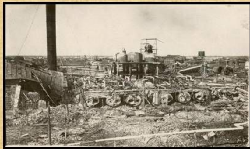
Завод им. Седина в г. Краснодаре после оккупации