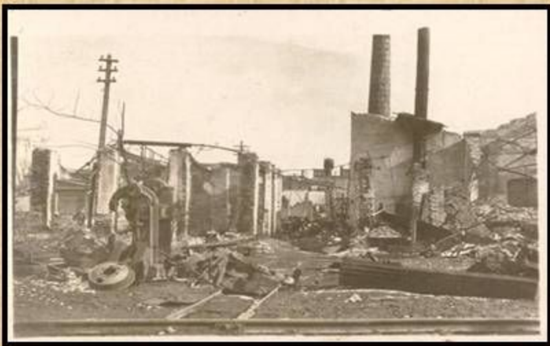
После оккупации. Нефтеперегонный завод в г. Краснодаре