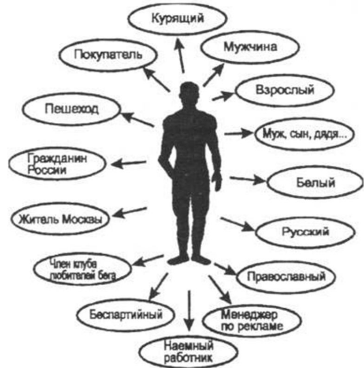
Статусный набор (портрет) человека

Любой человек занимает в обществе много позиций. Поэтому социологи говорят о статусном наборе - совокупность всех статусов данного индивида.