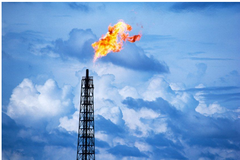
Нефтяные вышки (США)