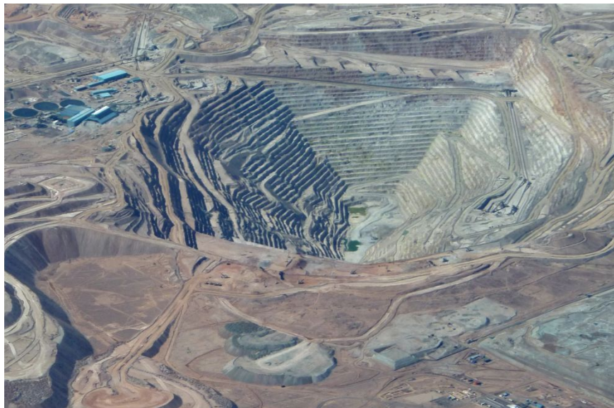
Карьер Эскондида (Чили)