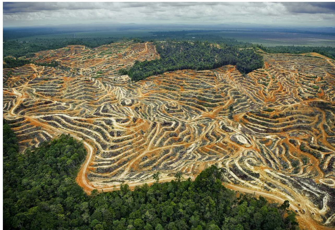
Вырубка лесов (Индонезия)