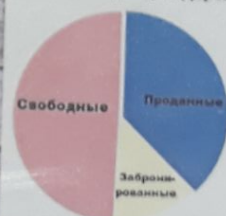
Дизайн интерьера руб/м²