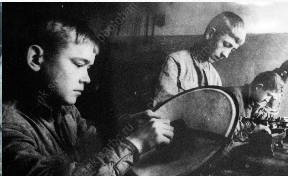
УЧАЩИЕСЯ РЕМЕСЛЕННОГО УЧИЛИЩА № 13 ЗА ИЗГОТОВЛЕНИЕМ РЕПРОДУКТОРОВ «РЕКОРД». Саратов, 1944 г.