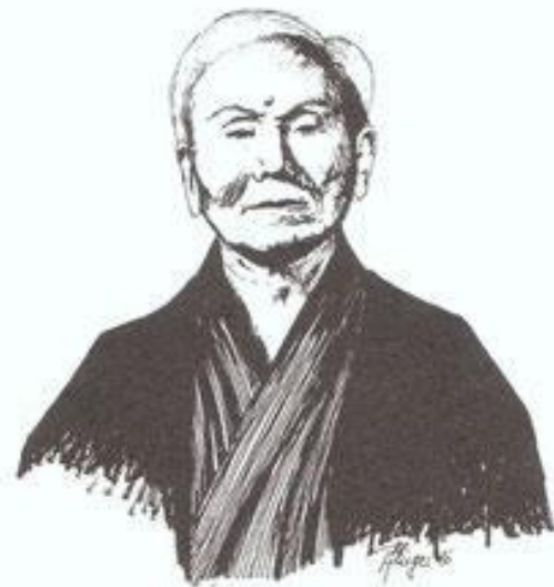
Гитин Фунакоши (1868—1957) — отец современного каратэ-до