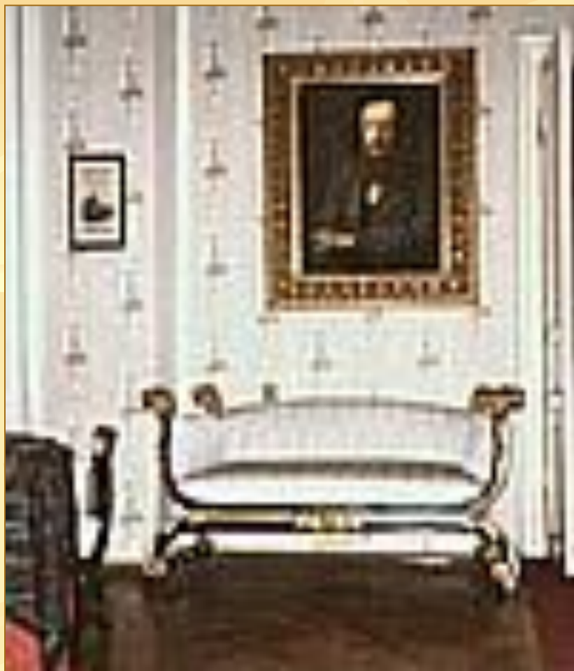
Музей – архив Д.И.Менделеева