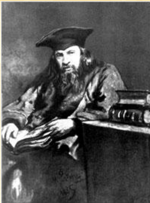
Д. И. Менделеев в мантии магистра наук.