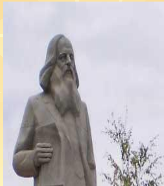
Памятник Д.И. Менделееву в Тобольске.

Российская Академия наук забаллотировала кандидатуру Менделеева в академики из-за его прогрессивных взглядов.