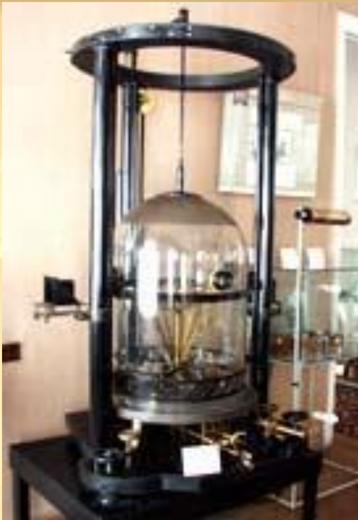
Метрологический музей Госстандарта России