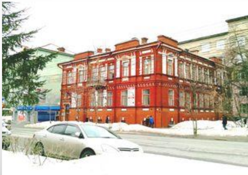
Здание Второго ремесленного (Королёвского) училища в наши дни.

В 1883 году Евграф Королёв основал первое в Сибири учебное заведение профессионального образования — Сибирское ремесленное училище (Королёвское), для чего пожертвовал дом стоимостью 35 тысяч. Это первое профессиональное учебное заведение в губернии, где мальчики, наряду с общеобразовательными предметами, получали навыки слесарного, столярного и сапожного ремесла. В 1896 году на базе Королёвского ремесленного училища на улице Почтамтской будет открыто учебное заведение II разряда - Первое томское государственное ремесленное училище, которое будет иметь там комплекс из 4-х зданий.