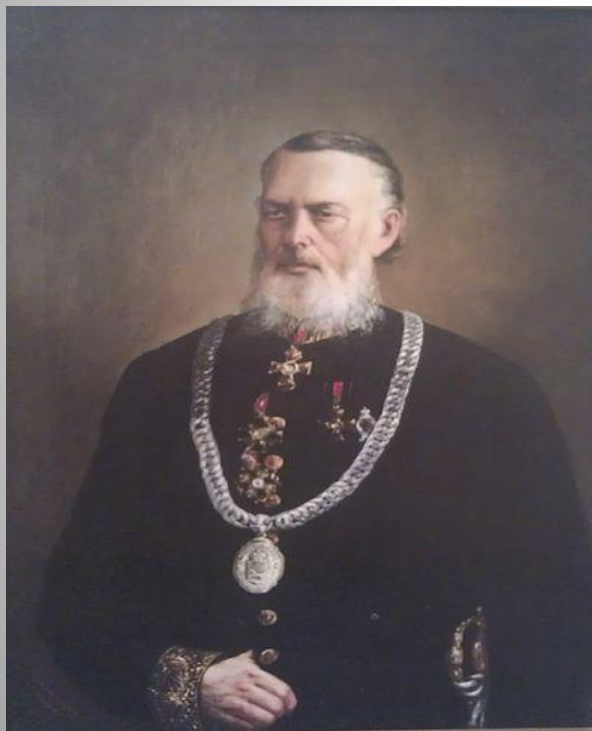
Евграф Иванович Королёв