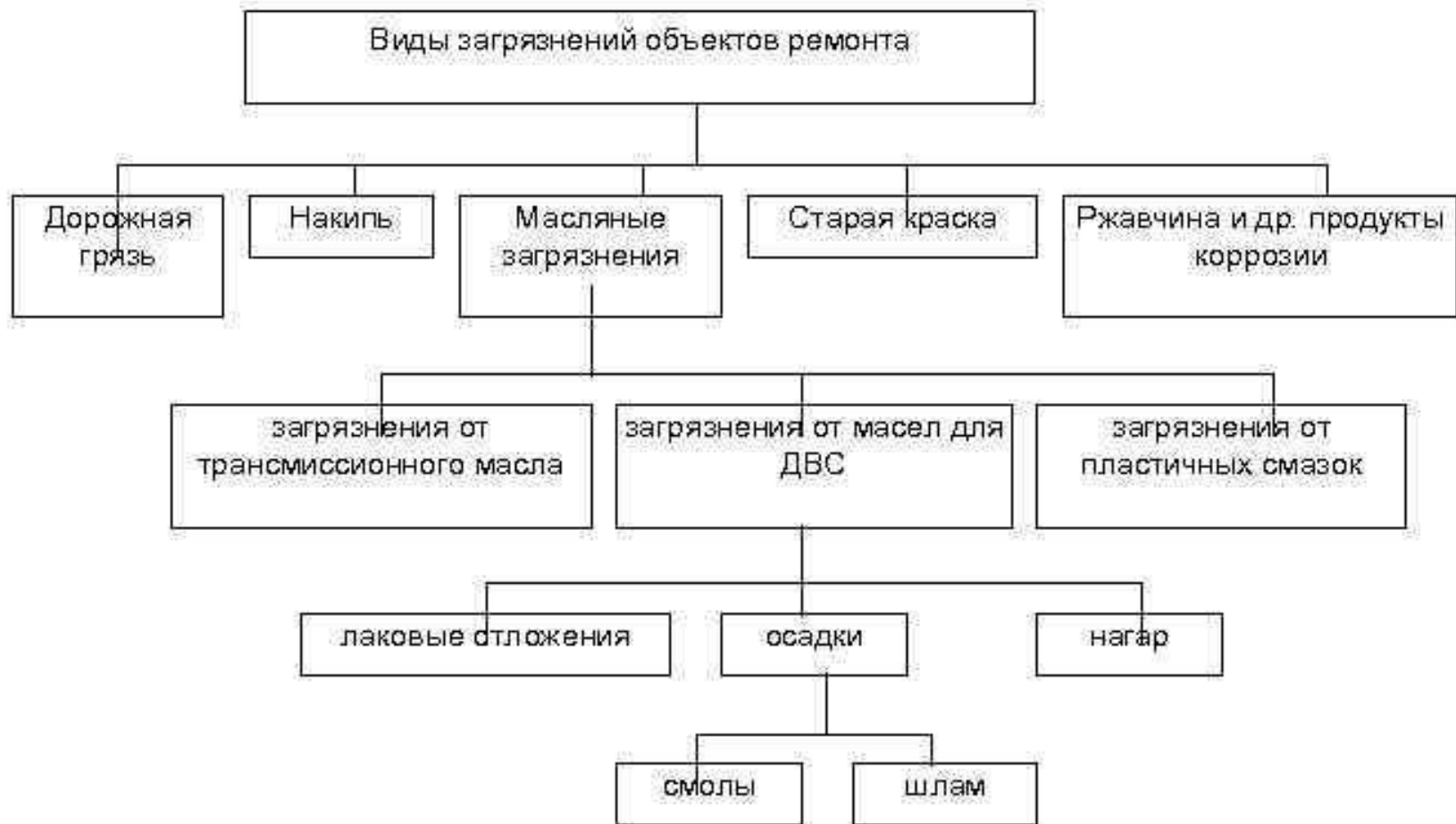
Рисунок 1 – Виды загрязнений