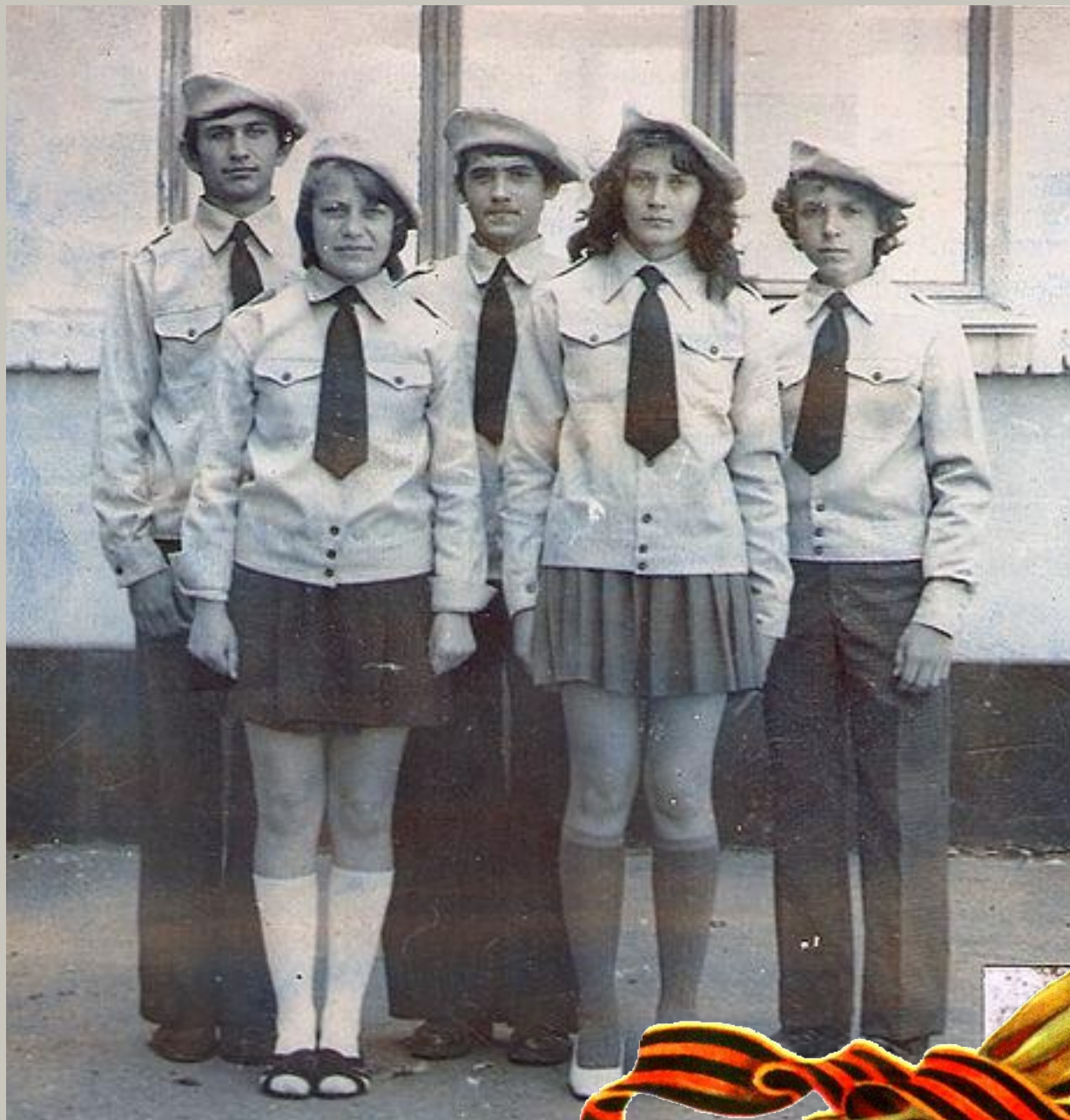
Члены отряда «Юный инспектор движения»