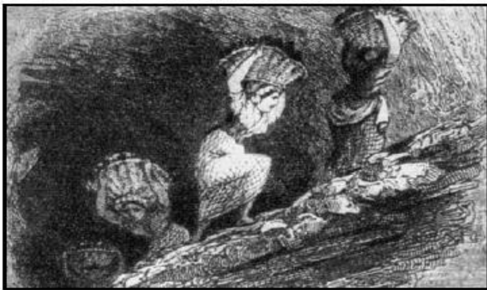
Рис. 3. Індія. Праця жінок в індійській копальні (малюнок XIX ст.)