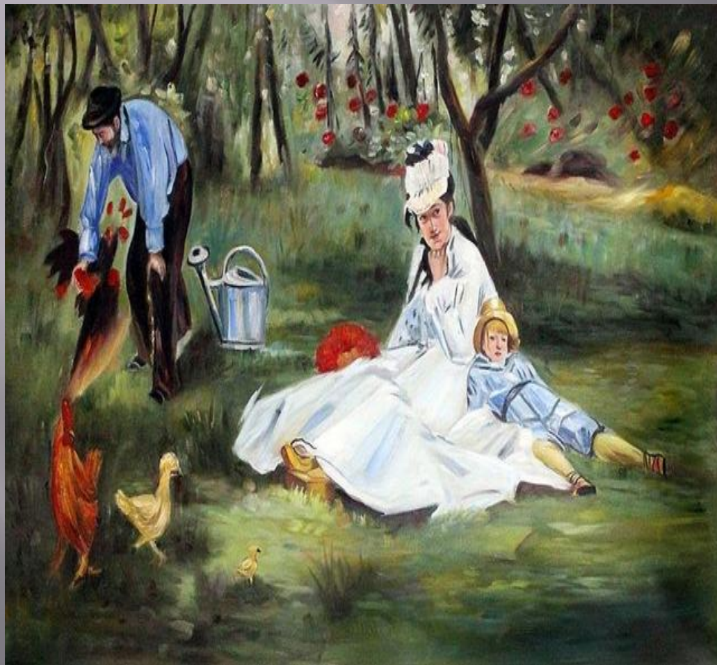
Семья в саду