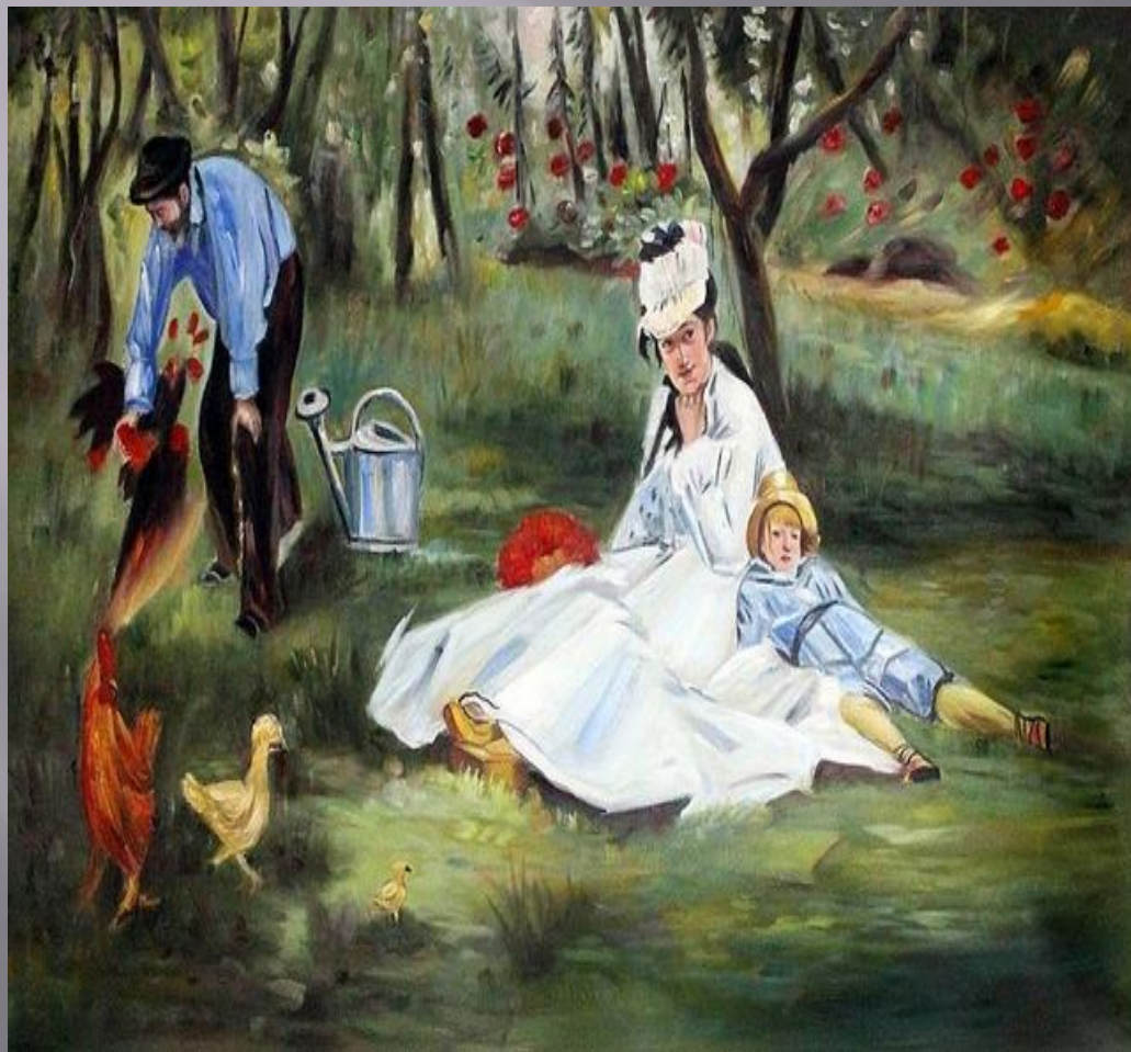
Семья в саду