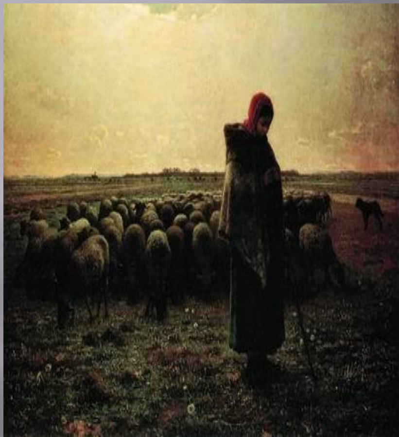
Пастушка, стереущая стадо. 1864