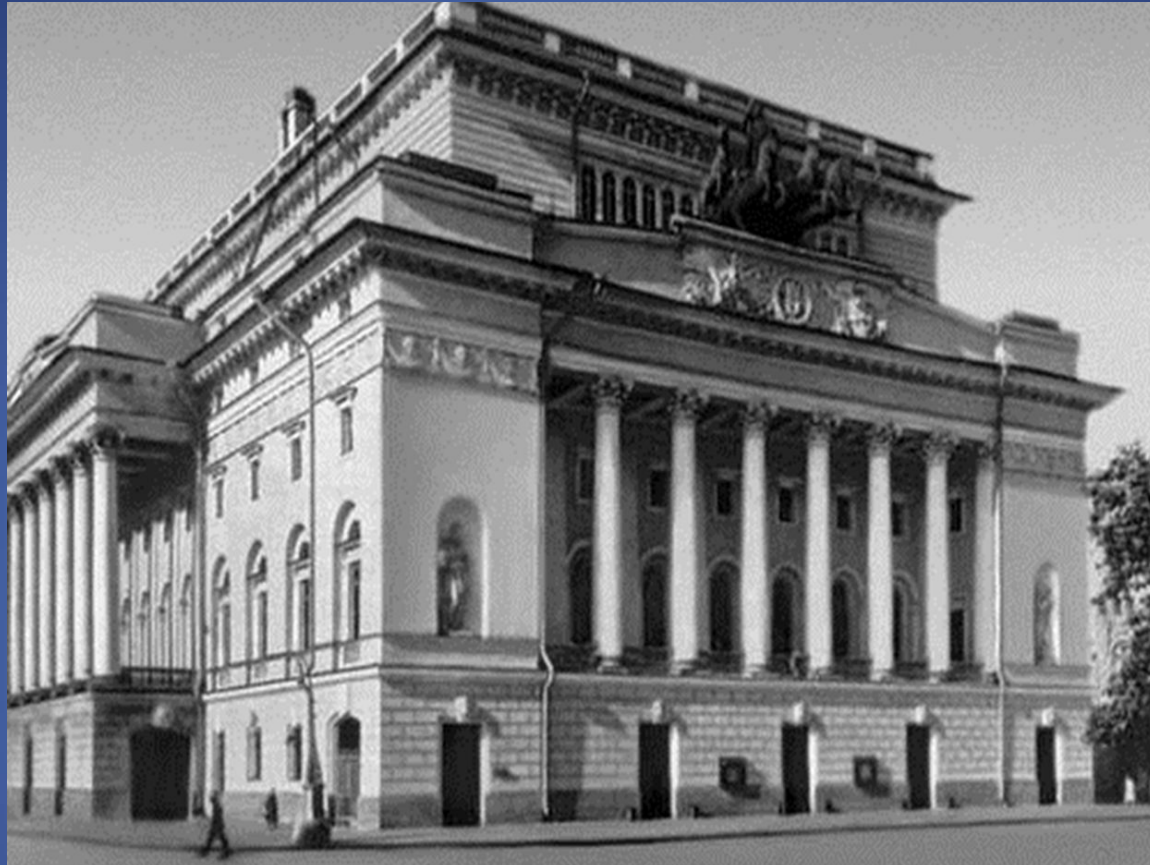
МЫ. БЫВ. Александринский, 1832