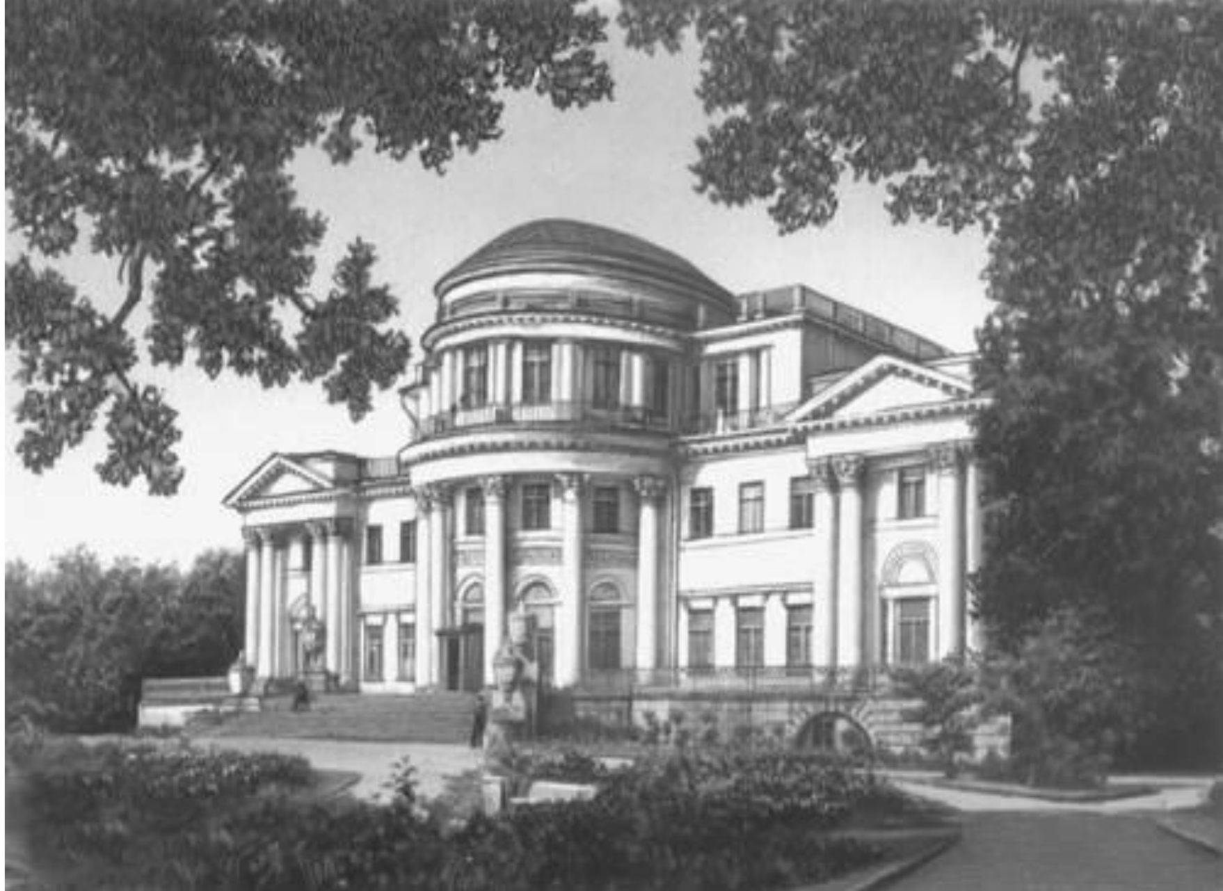
Ленинград. Елагин дворец. 1818—22.