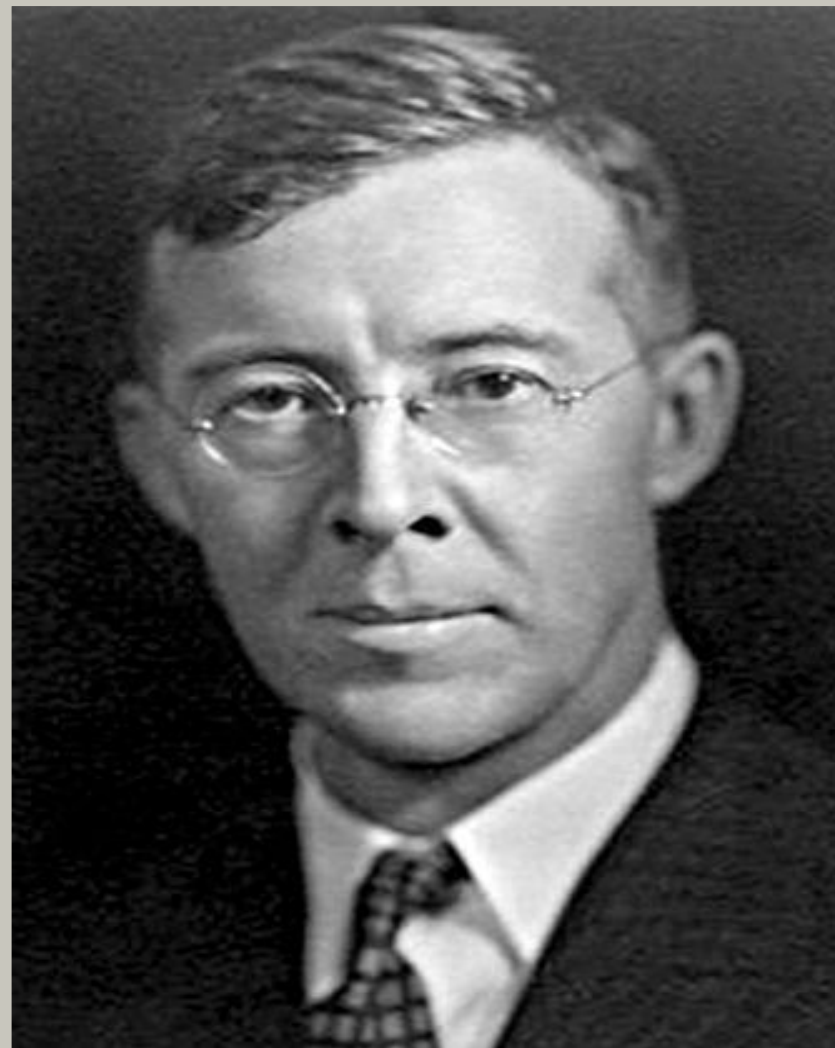
П.А.Сорокин (1889 - 1968)

Екінші дүниежүзілік соғыстан капиталистік және социалистік екі әлеуметтік – экономикалық жүйені конвергенциялау (жуықтау) теориясы пайда болды. Теорияны алғаш рет 1944 жылы Питирим Сорокин жария етті.