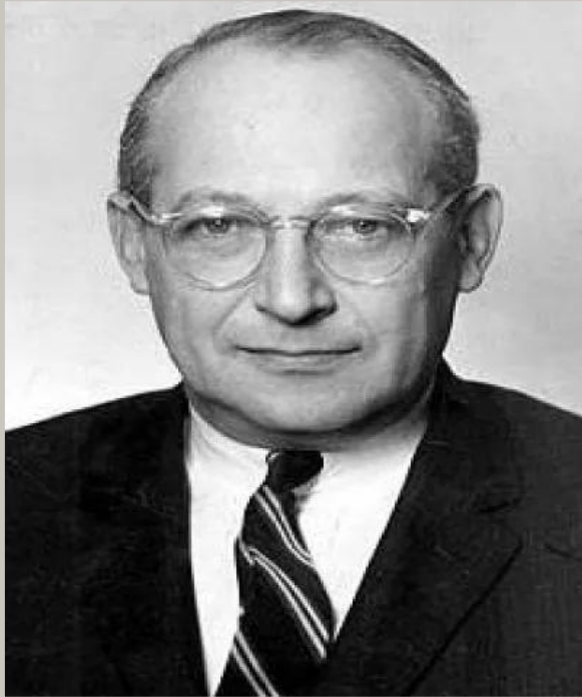
У.У.Ростоу (1916 – 2003)