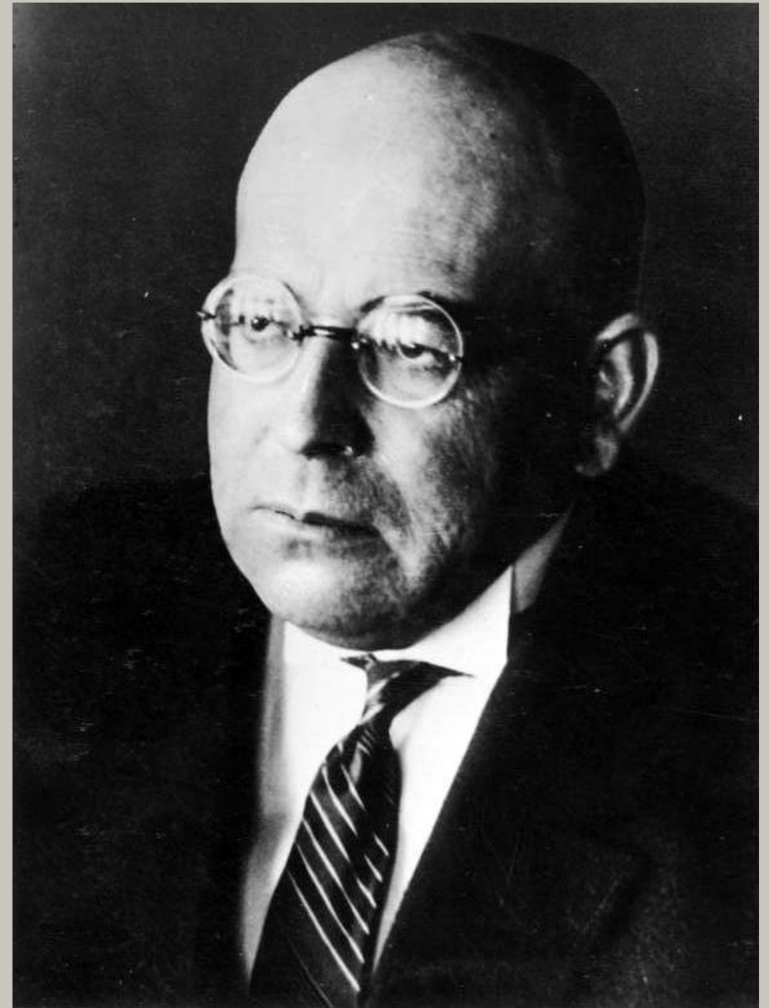
О.Шпенглер (1880- 1936)

Өркениеттік тұрғыдан қарау адамды тарихты қалыптастырушы жасампаз ретінде бағалап, қоғамдағы рухани факторларының дамуына, жекелеген қоғамдар мен мемлекеттердің және халықтар тарихының ерекшелігіне басым бағыт береді