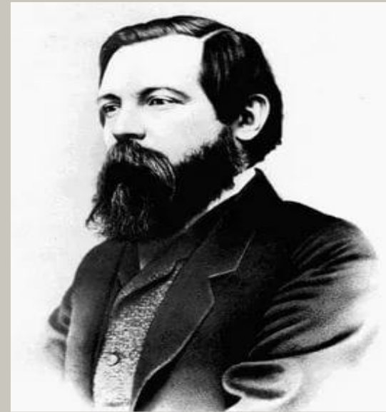
Фридрих Энгельс 1820 - 1895

Формациялық тұрғыдан қарау. Бұл бағыттың негізін Карл Маркс пен Фридрих Энгельс болды. Олар қалыптастырған теория бойынша, адамзат қоғамы төменгі сатыдан жоғарыға қарай дамиды. Тарихи процесс – қоғамдық – экономикалық формацияның, яғни белгілі бір өндіріс тәсілдеріне негізделген қоғамның тарихи түрінің заңды, объективті келісілген ауысуы.